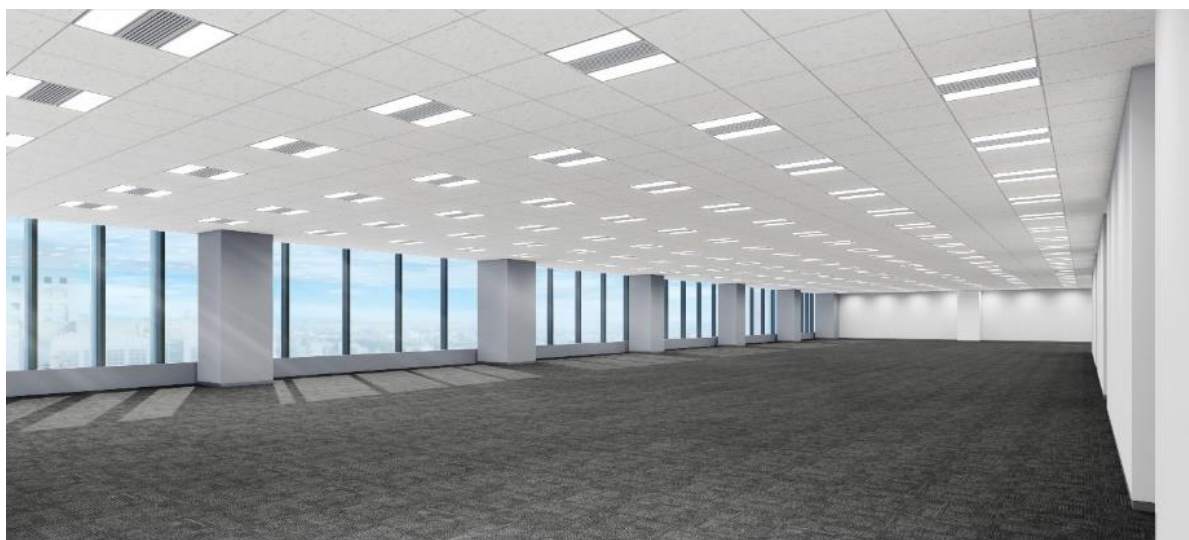
オフィスフロアイメージ