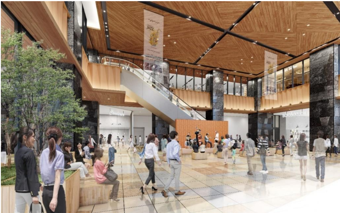
「ダテリウム」イメージ