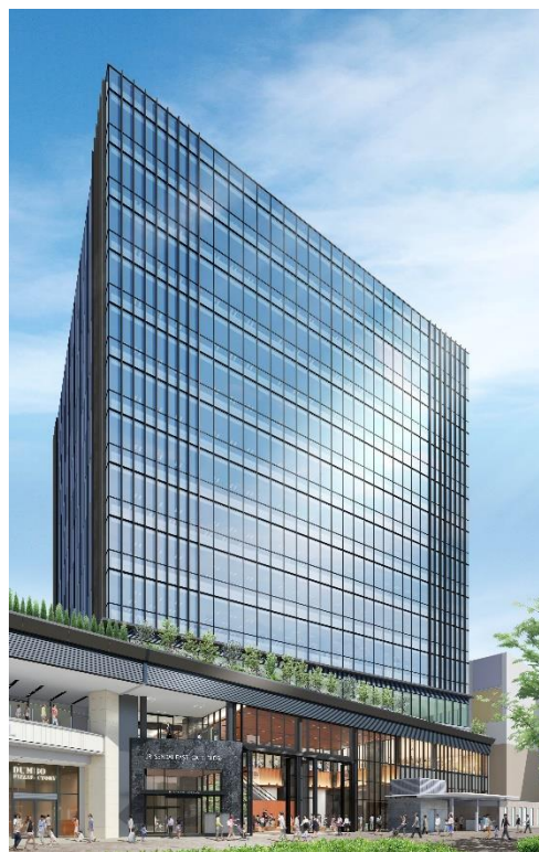
建物外観イメージ