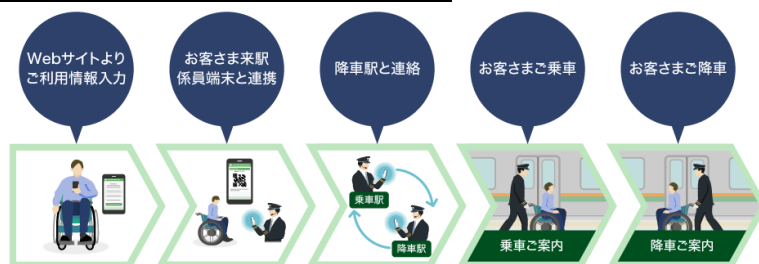
「JRE おでかけサポート」イメージ図

サービス開始日：2024年2月26日(月)※2024年2月28日(水)以降ご利用分から受付開始します。