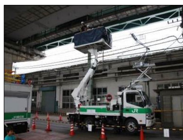
高所作業車 乗車体験