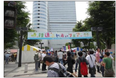
鐘塚公園会場風景