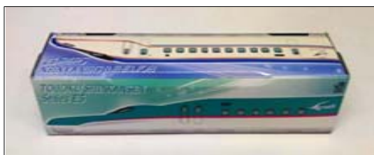
【オリジナル・新幹線デザインNEWクレラップ】