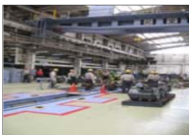
車両メンテナンス作業実演