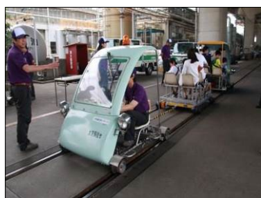
レールスター 乗車体験

工事用車両（レールスターや高所作業車）の乗車体験、実際の車両を使用しての業務体験などができます。