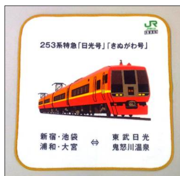
【オリジナル・ハンドタオル】

(1) 実施時間 9時30分～16時00分(大宮総合車両センターは15時30分まで)