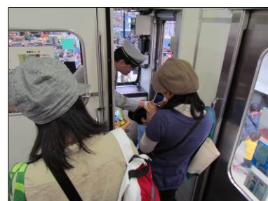
業務体験(車掌体験)