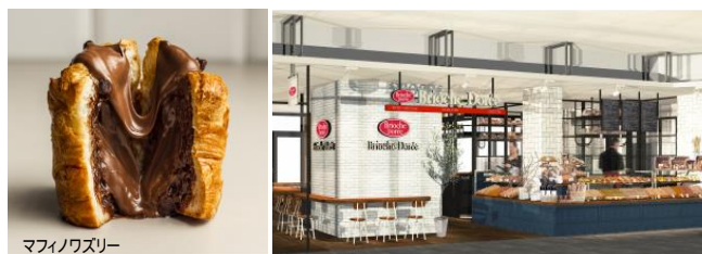
マフィノワズリー

フランスで300店舗展開しているベーカリーカフェが中央線沿線初出店。同ブランドでは最大級規模の店舗となります。フランス産小麦と発酵バターを使ったクロワッサンや2015年11月に日本初上陸したフランスで人気のハイブリットスイーツ「マフィノワズリー」などをラインナップ。夜はワインも提供、プチビストロとしてご利用いただけます。