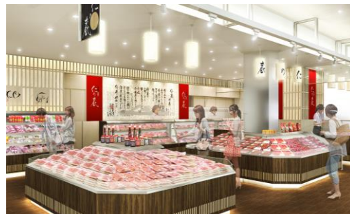
仁の蔵 イメージパース