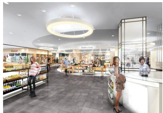
【館内】 シックな色合の床や天井で洗練された雰囲気を演出