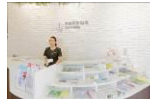
コンシェルジュ (イメージ)

よりわかりやすく駅やショッピングセンターをご利用いただけるサービス提供を目指すとともに、館内にデジタルサイネージを3箇所設置し、地域の情報、ショッピングセンターの情報を発信していきます。