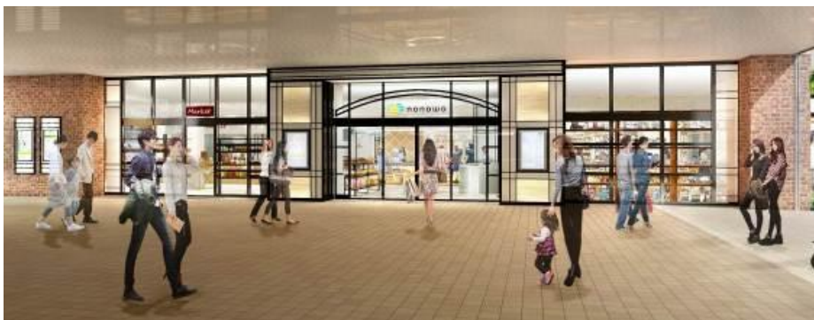
【正面エントランス】 黒を基調とした落ち着いたファザード

駅は街のエントランス、nonowa 国立は、街とともにいろいろなヒト・モノ・コトの集まる街のリビングのような存在へ。訪れるお客さまに洗練された上質なライフスタイルを提案します。