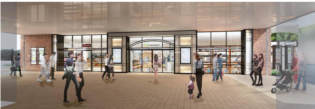
【改札を出て正面より】