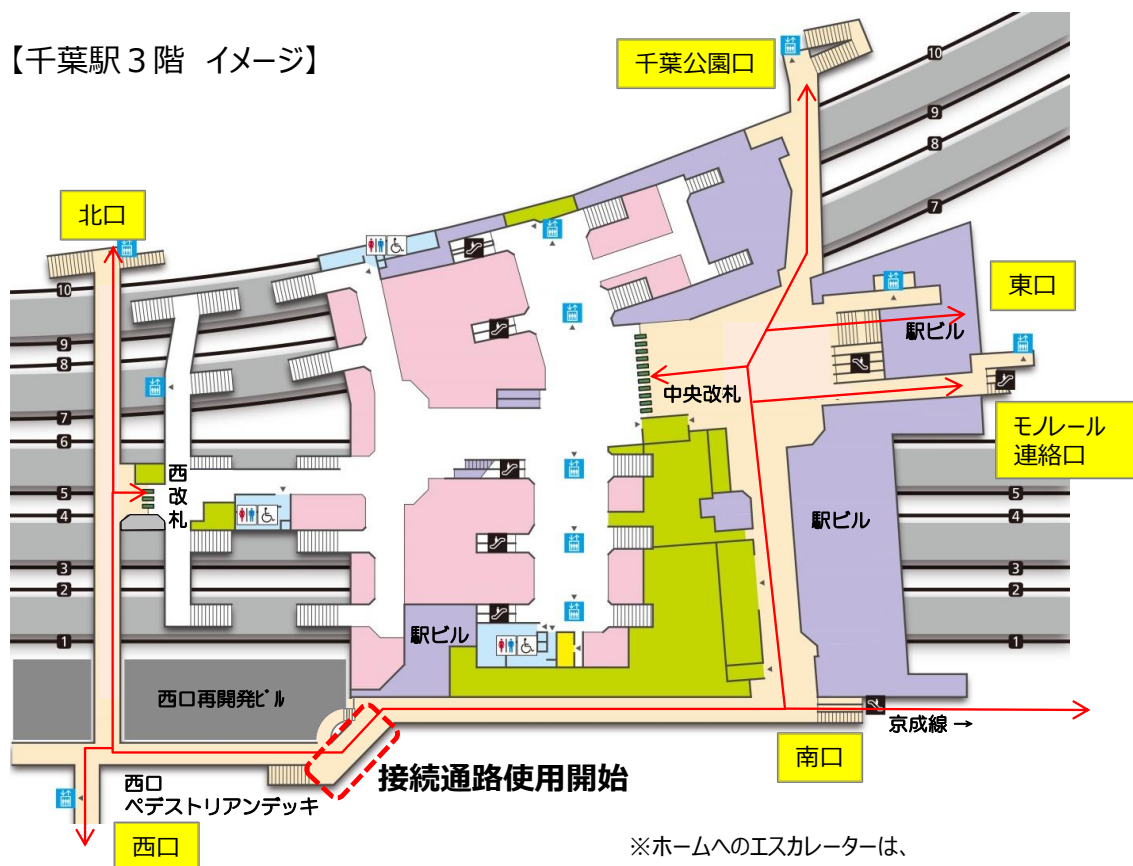
【千葉駅 3 階 イメージ】

※ホームへのエスカレーターは、 9月初旬(1～6番線)から10月(7～10番線)に 使用開始予定です。その他一部工事エリアが残ります。