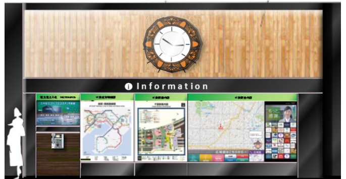
〈待合せ空間（ハスの時計）〉

あたらしい千葉駅の待合せ空間の「ハスの時計」前で開業式典を執り行います。 併せて「ハスの時計」の除幕式を行ないます。