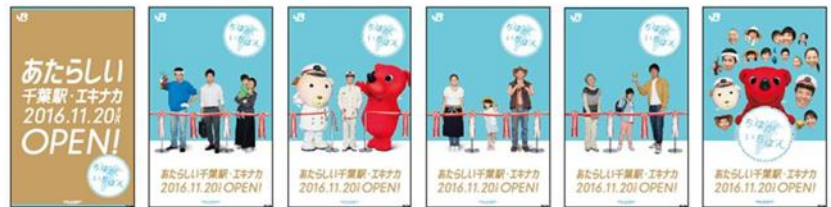
あたらしい千葉駅・エキナカ 2016.11.20 OPEN!