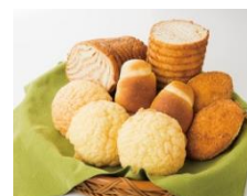
ピーターパン Jr 定番商品群