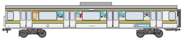
「千葉駅開業」209系電車 広告表示意匠図

を内房線、外房線、総武本線、成田線 東金線、鹿島線（予定）に運行します。 開業当日は記念列車の出発式を行います。