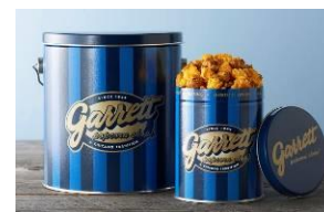
ギャレット ポップコーン ショップス