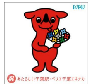
チーバくんフラッグ