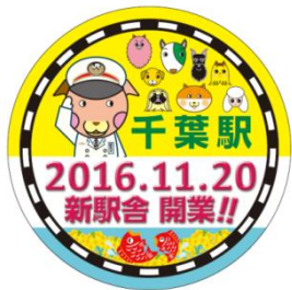
開業記念ヘッドマーク