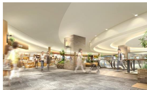
〈エキナカ4階（イメージ）〉