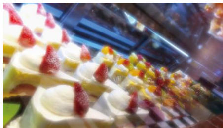
Artisan in CHIBA