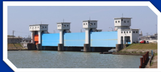
<写真:上段_新潟大堰、下段_信濃川水門>