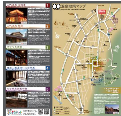
情報板イメージ図

湖岸周遊ルートの利用実態について、地元住民や利用者から聞き取りアンケートを行い、利用促進に繋がる施策を実験し調査する。