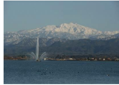
柴山潟湖畔からの白山眺望

片山津温泉地区は、優れた眺望景観を有する柴山潟湖畔に広がる温泉街である。観光地として発展してきた本地区であるが、消費者ニーズや旅行形態の変化などで観光客数は、昭和55年の1,514千人をピークに平成19年には322千人にまで減少し、現在営業している旅館数は全盛期の1/3以下になっている。まちづくり総合支援事業(H14～H18)及び都市再生整備事業(H19～H23)では、総湯、広場、足湯、遊歩道、散策路小路や街路の整備などに取り組み、温泉街の魅力向上が図られている。課題としては、①白山眺望や柴山潟湖畔など優れた眺望景観を有しているが、柴山潟湖岸に温泉旅館が建ち並んでいるため、市街地から潟を望むことが出来ず、湖畔の温泉地として地域資源が活かされていない。②まち歩きが楽しめる湖岸の周遊ルートと、来訪者のための観光駐車場が必要である。③インバウンド観光の推進により、外国人観光客は増加傾向にあるが、外国人のまち歩きに対応した回遊環境の整備がされていない。このため地域住民のほか、旅館事業者や地元観光協会が主体となったまちづくりを推進し、片山津温泉の魅力向上による更なる賑わい創出が求められる。