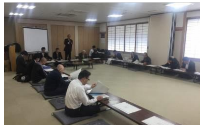
柴山潟湖岸遊歩道計画連絡調整会議

片山津地区は、柴山潟周辺からの眺望景観を保全し、市街地と柴山潟が一体となった魅力ある観光地の形成を目指しており、水辺の周遊ルートを中心とした歩いて楽しい散策路の重要性の認識から、H28年度に住民、沿線事業者を交えた柴山潟湖岸遊歩道計画連絡調整会議を3回開催した。石川県の施工している浸水対策の堤防を利用した遊歩道計画を策定するとともに、温泉街の魅力的なまちづくりを推進している。