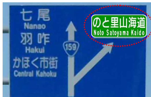
標識変更後のイメージ