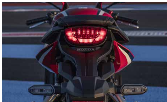
■CBR650R テールランプ/ストップランプ点灯 (写真は欧州仕様車)

新設計のLEDテールランプを採用。レンズには縦方向に発光面積を増幅させるフルート(溝)カットと下側を取り巻くようにシボ加工を施し、コンパクトながら豊かな光りの表情を実現しました。さらに制動時には内蔵されたストップランプが点灯することでメリハリのある視認性に配慮しました。