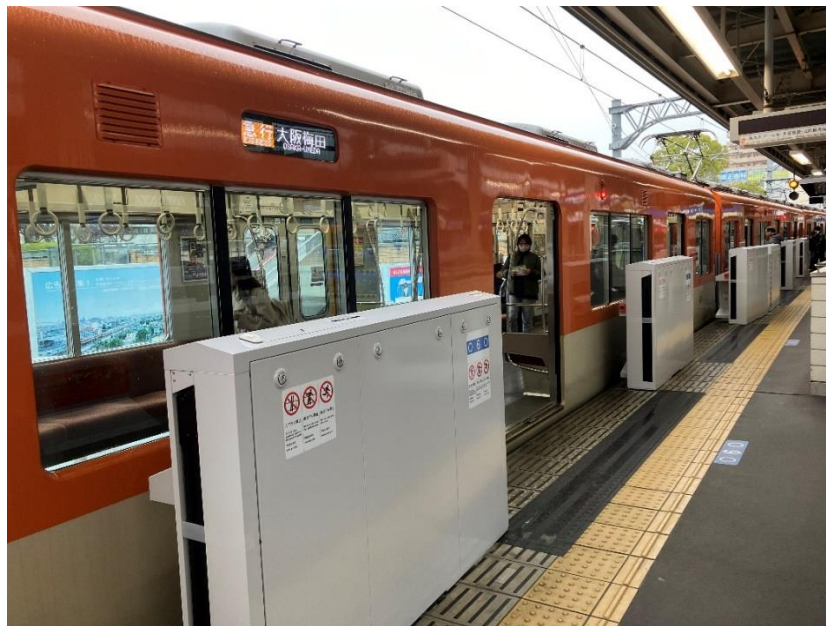
尼崎駅1番線ホームドア