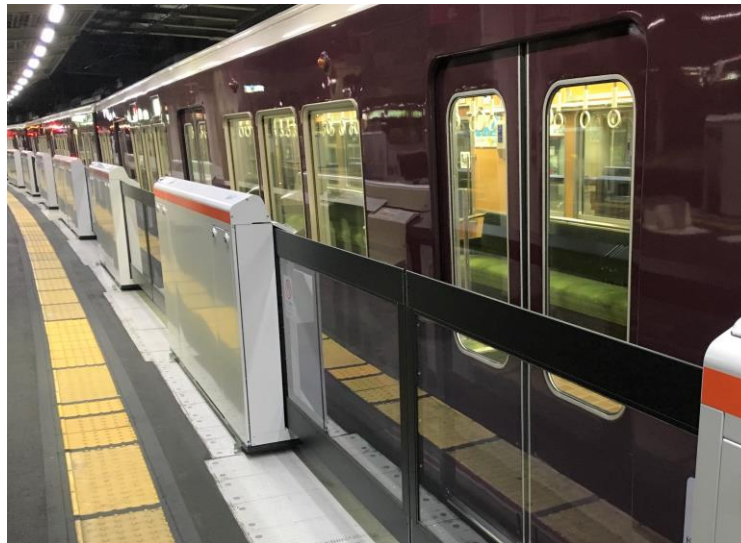
可動式ホーム柵（十三駅4号線）