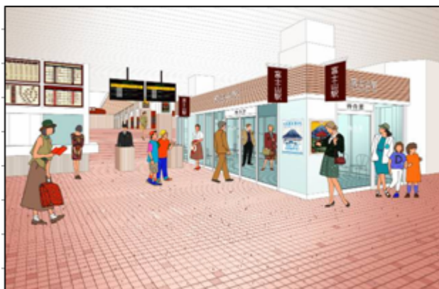
(コンコースイメージ)

待合室をコンコースに移設し、新たに四方をガラス張りとした、開放感あふれるデザインとしました。プラットホーム上には、電車を待つ間に、ちょうど富士山を正面に仰ぐ位置で眺望をお楽しみいただけるよう、新たに「展望デッキ(仮称)」を設置します。