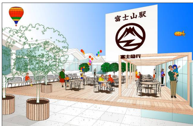
(屋上展望テラスイメージ)

駅周辺では最も高い建物である6階建てターミナルビルの屋上部分には、ウッドデッキにベンチやテーブル、緑の植栽を配した「屋上展望テラス(仮称)」を設置します。左右に大きく裾野を広げた秀麗な富士山の姿を、遮るものなく正面に望むことができます。