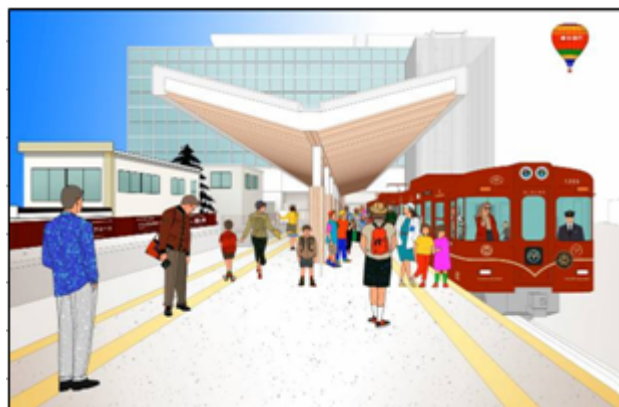
(プラットホームイメージ)

DESIGNED & ILLUSTRATED BY EIJI MITOOKA + DON DESIGN ASSOCIATES