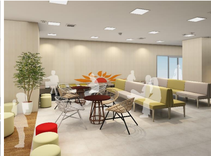
▲ リニューアルイメージ

株式会社フェリーさんふらわあは、今年11月に迎える設立10周年の記念事業の一環として、『さんふらわあターミナル(大阪)第1ターミナル待合所』(アジア太平洋トレードセンター内)を大規模改修し、10月18日(金)にリニューアルオープンいたします。