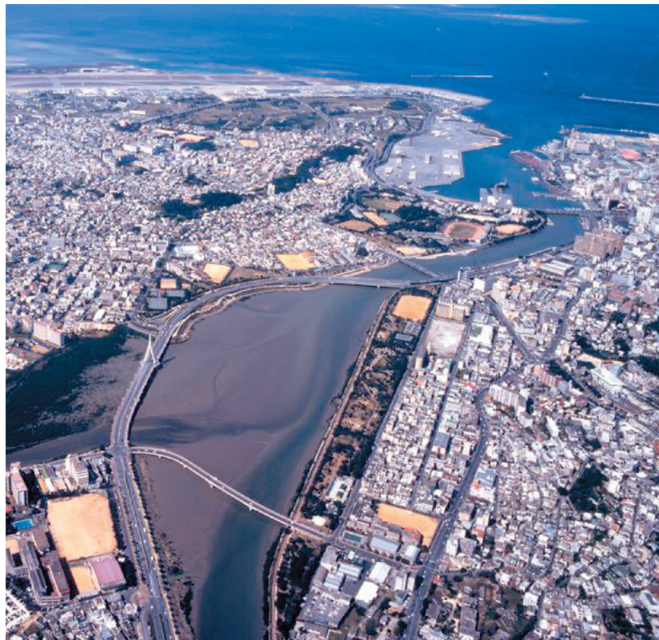
東上空から見た漫湖