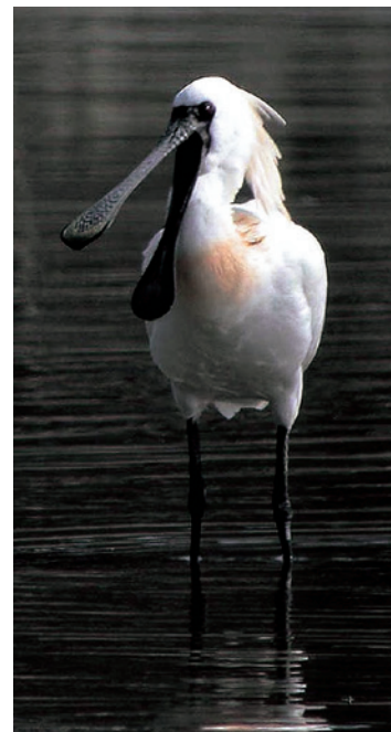
クロツラヘラサギ