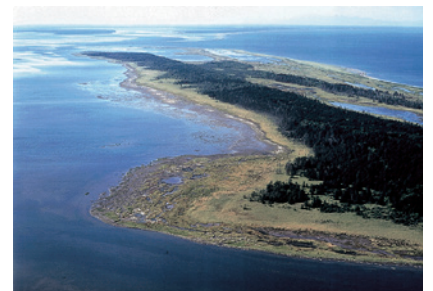
上空から見た春国岱