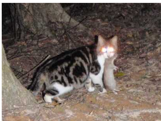
2012年3月12日 奄美市森林内 ケナガネズミ