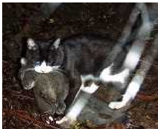
2008年6月27日 宇検村森林内 アマミノクロウサギ