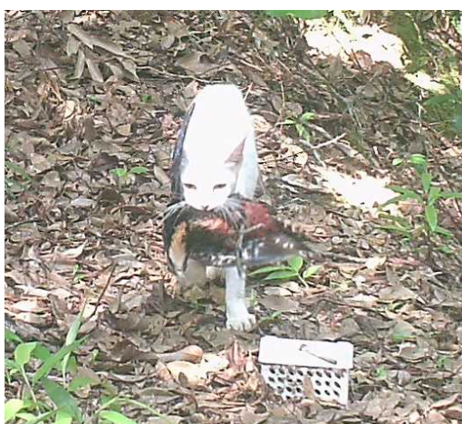
2014年6月7日 龍郷町森林内 オーストンオオアカゲラ