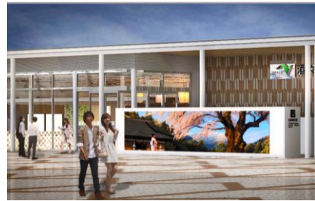
《LEDビジョン イメージ》