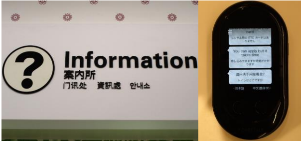
《ピクトサイン・多言語での案内表示》 《翻訳機》