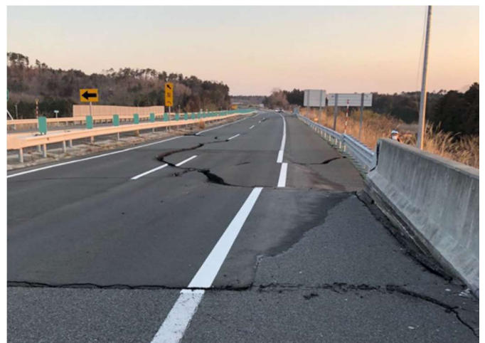
E6常磐道(上下線)新地IC～山元IC