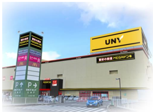
MEGAドン・キホーテUNY鈴鹿店 周辺地図