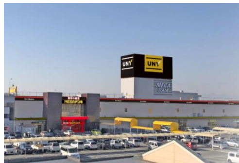
MEGAドン・キホーテUNY伊勢崎東店 周辺地図