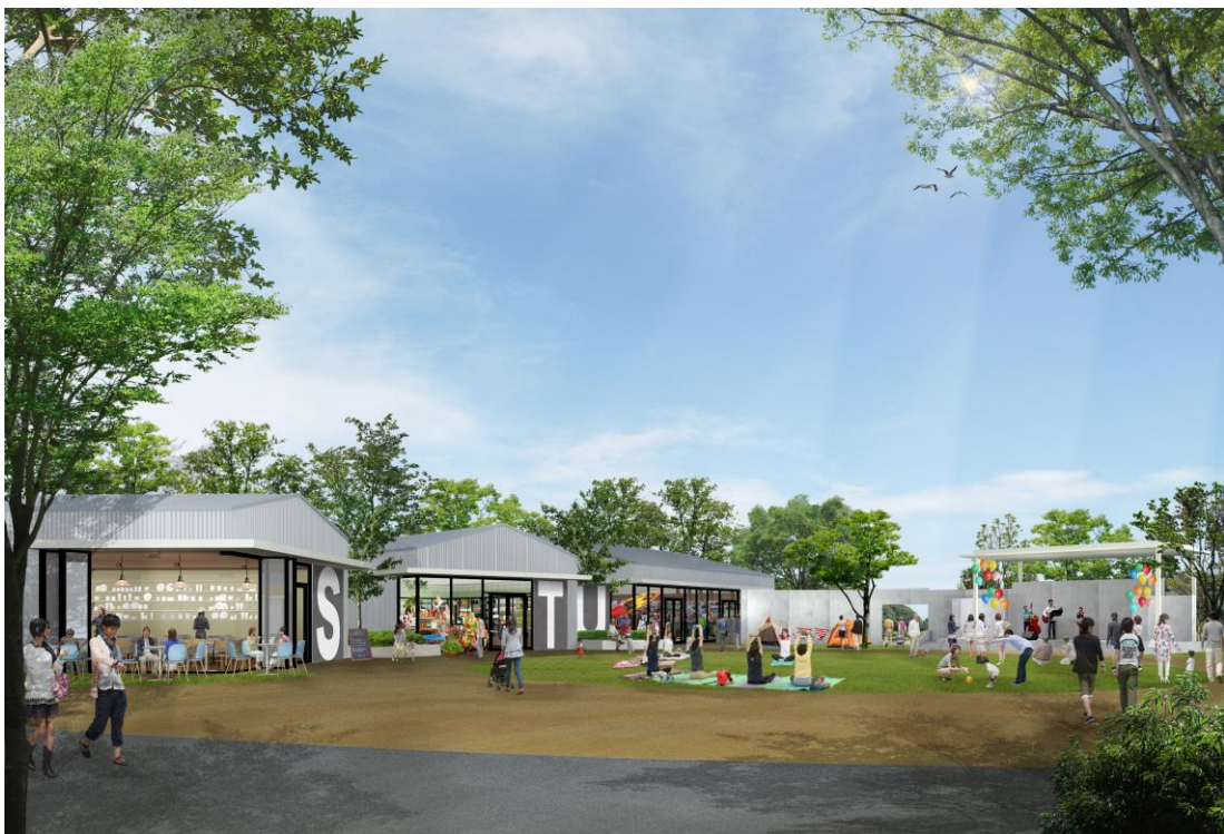
完成予想イメージ ※イメージであり実際とは異なる場合があります。

当施設は駅前の立地を生かし、生活・利便エリアに食品スーパー・ドラッグストア・フィットネス・医療モール、体験・滞在エリアに書店・飲食店・カフェ・専門店・保育園などさまざまな機能の店舗を配置。また、芝生広場などの緑豊かな空間を整備するなど、買い物だけでなく通いたくなる「場」を提供します。「ブランチ岡山北長瀬」は地域コミュニティを生み出し、子どもから高齢者まで多様な世代が共存共栄し合える魅力的な施設を目指します。