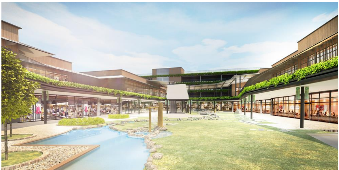
完成予想イメージ ※イメージであり実際とは異なる場合があります。

本施設は1985年から2015年まで当社が開発運営していた長命ヶ丘商業施設の跡地に新たに整備したものです。本計画地は青葉区と泉区の2つの区画に分かれており、2018年11月、青葉区桜ヶ丘に1期として毎日のお買い物に便利なスーパーマーケット、ドラッグストア、100円ショップ、歯科医院、整骨院が先行オープン。今回、泉区长命ヶ丘に2期として書店、インテリア、飲食店、クリニックモール、フィットネスなどの生活利便性向上やライフスタイルを提案する店舗がオープンし、地域交流スペースや施設の中央に緑化広場を配置するなど、買い物だけではなく通いたくなる「場」を提供します。また、2019年5月下旬には1期に子どもと母親が離れず働ける託児機能付きオフィス「ママスクエア」が東北初出店をする予定です。「ブランチ仙台」は買い物だけではなく、地域コミュニティを生み出し、子どもから高齢者まで多様な世代が共存共栄し合える魅力的な施設を目指します。