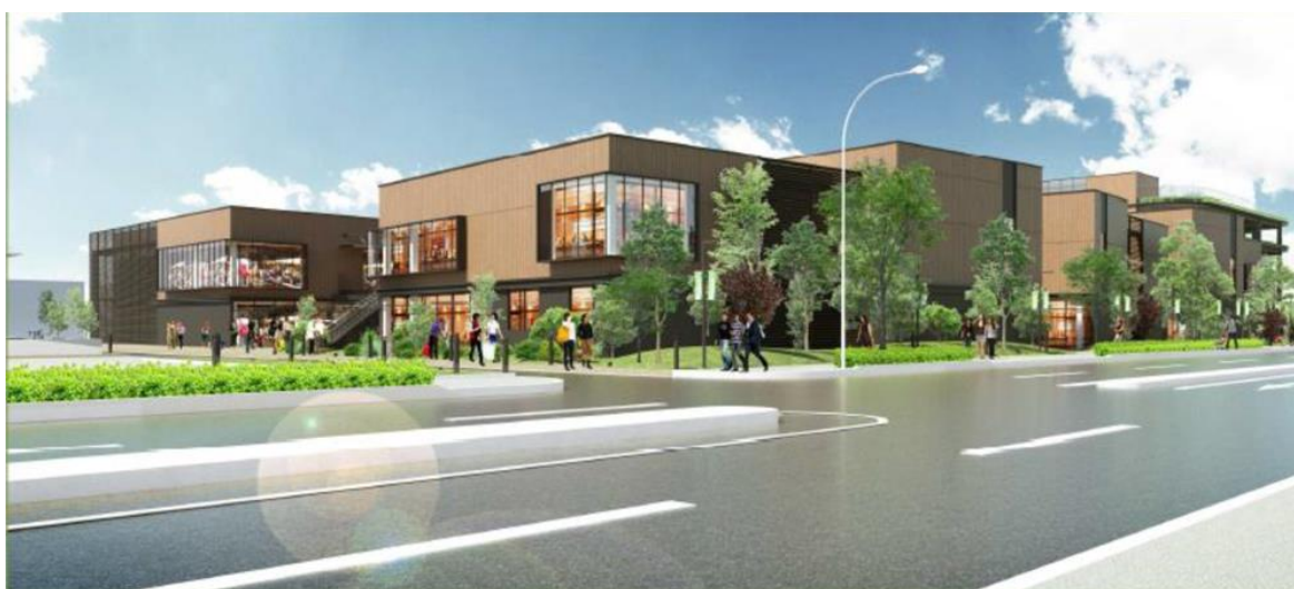
完成予想イメージ ※イメージであり実際とは異なる場合があります。

4月25日(木)AM9:30より、2期施設内の1階中央広場にてオープニングセレモニーを執り行います。