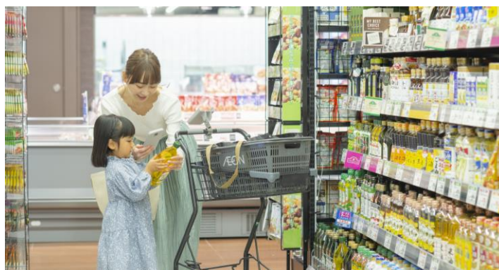
③専用スマホのカメラで購入する商品のバーコードをスキャン！野菜や果物などバーコードが付いていない商品は、画面上のタッチパネルでも商品を選択できます。