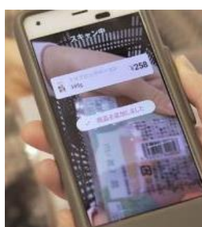
④スキャンすると、画面上に商品が追加されます。購入商品は一覧として確認ができるため、買い忘れ防止にもつながります。複数点買う場合は、画面上のプルダウンで個数を選択し、キャンセルは「×」を押すだけなので簡単！