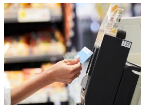
⑤お会計は、専用スマホ内の「お支払い」を押した後に、専用レジの2次元バーコードを読み取るだけで、お買物データの送信が可能に！ ⑥現金、電子マネー「WAON」、クレジット決済をご選択いただけます。