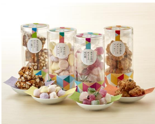
農事組合法人ふるさと明日香（明日香村） 「あすかさんぼ グラノーラクッキー／琥珀糖／ メレンゲ／ポン菓子」

株式会社近鉄百貨店は、地域社会と共に成長・発展する地域共創型の百貨店として、今年3月より地域商社事業の取組みを開始し、最初の取組みである奈良県内において地域の新たな魅力を生み出す商品開発プロジェクトを進めてまいりました。この度、奈良県内の自治体・生産者である「農事組合法人ふるさと明日香（明日香村）」「山添村」「吉田屋」「レストランテ リンコントロ」と連携し、地域商社事業第一弾となる奈良の新たな名産品が誕生しましたのでお知らせします。4つの自治体・生産者と取り組んだ11の新商品については、奈良の新たな魅力を生み出し発信するコンセプトショップ「大和路ショップ」（近鉄百貨店 奈良店地階フロア内）にて11月21日（水）より販売開始します。