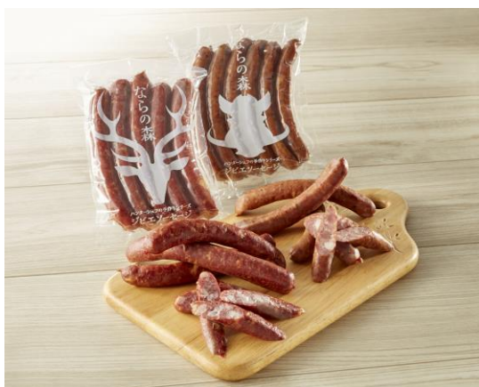
レストランテ リンコントロ 「～ならの森～ ハンターシェフの手作りシリーズ ジビエソーセージ シカ／イノシシ」