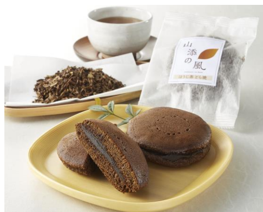
山添村 「山添の風 ほうじ茶 どら焼／まんじゅう 抹茶 どら焼／まんじゅう」