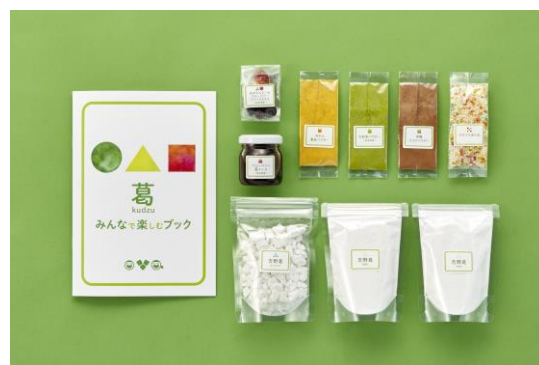
吉田屋 「葛をみんなで楽しむキット」