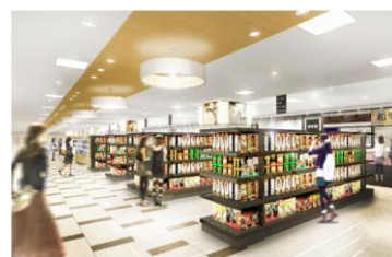
グロサリーゾーン