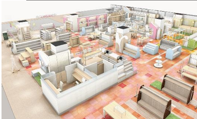
<ハロー赤ちゃん>大阪初出店 ママと赤ちゃんの毎日をおしゃれに彩るベビー専門セレクトショップ。ベビーのためのウェア、寝具、家具、乗り物、玩具、マタニティーウェア&グッズなどが揃います。