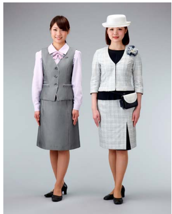
左：一般女性社員 右：お客様サービス係