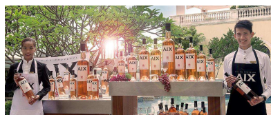
テイスティングイベント/ディナーイベント