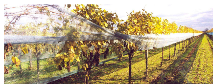
中国内外へのワイナリーツアー