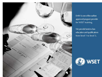
WSET認定ソムリエの下で 教育プログラムを開催