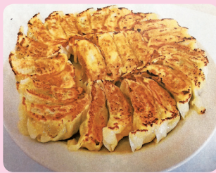
優秀賞 八街産しょうが餃子 株式会社ハマトミ食品 ☎442-1878