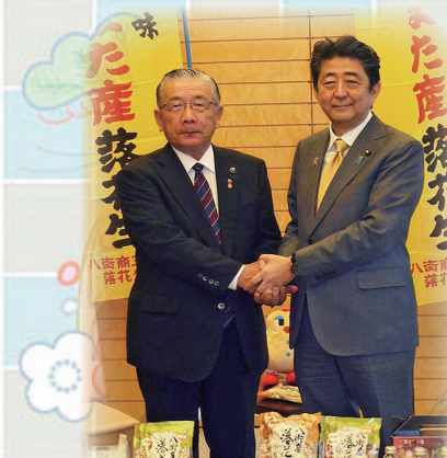
安倍総理に落花生をPR(平成30年11月22日)