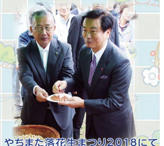
やちまた落花生まつり2018にてQなっつがデビュー(平成30年10月14日)