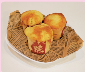
最優秀賞 八街ジンジャーエールマフィン 有限会社ベーカリーいこい ☎443-1151