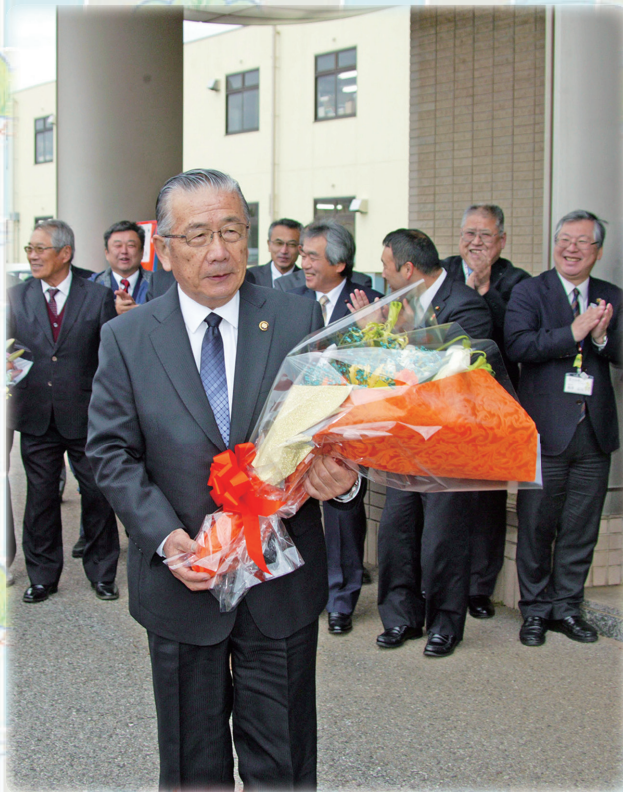
北村新司市長が初登庁(平成30年12月11日)