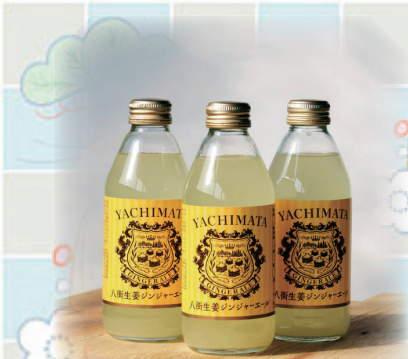
八街生姜ジンジャーエールが「食のちばの逸品を発掘2018 コンテスト直売所部門」で金賞を受賞(平成30年3月8日)

人口の動き 12月1日現在 人口70,460人(前月比-43人) 男35,907人女34,553人世帯数31,624世帯