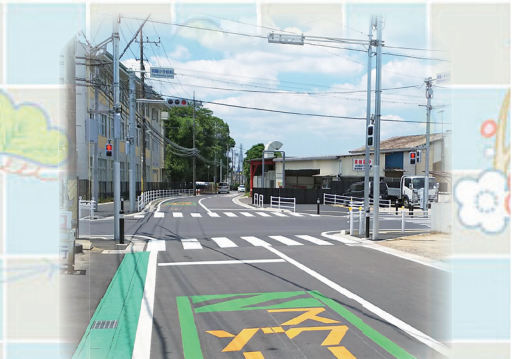
国道409号 朝陽小学校脇の交差点改良(平成30年5月10日)