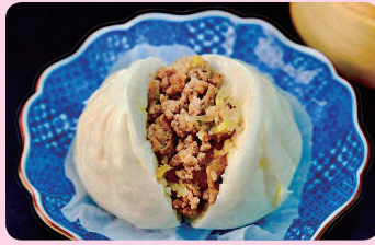
優秀賞 しょうがまん 来豊園 ☎442-6887