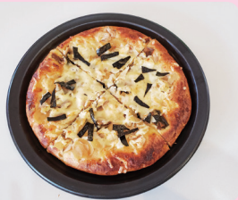
優秀賞 八街しょうがの和風ピザ 有限会社ベーカリーいこい ☎443-1151