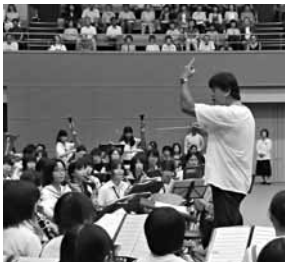
▲平成23年度実施事業 佐渡裕氏による 吹奏楽クリニック