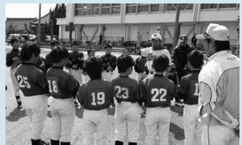
▲野球少年と交流する神戸サンズ