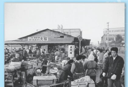
駅前魚市場の様子(昭和40年)↑