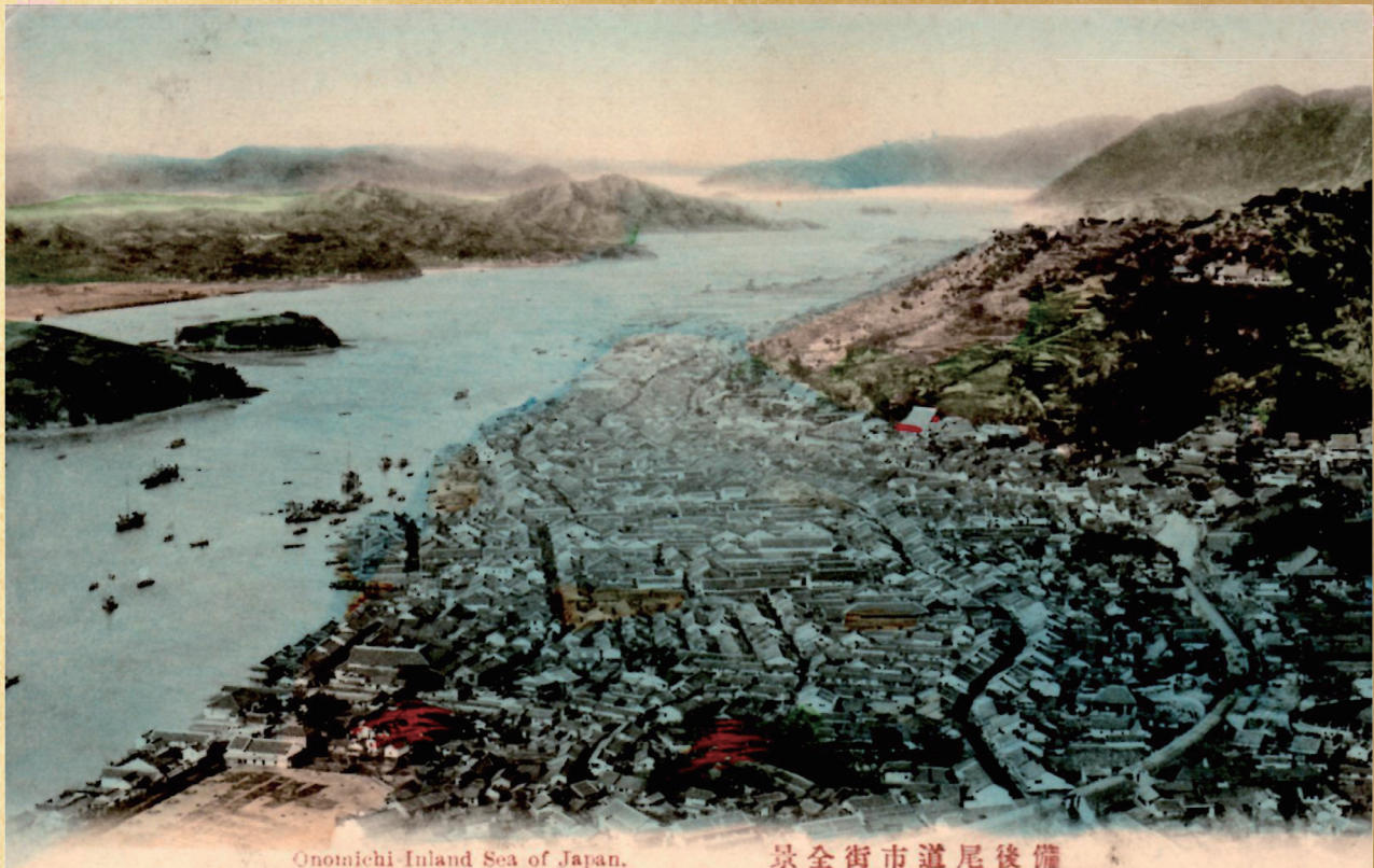
Onomichi Inland Sea of Japan.