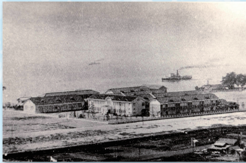
↑ 広島県立尾道商業高等学校(創立130年) 明治21年、尾道商業学校として久保町に開校、その後 明治25年長江町へ、昭和14年吉和町へ移転 (写真は昭和14年吉和町へ新築移転した時のもの)