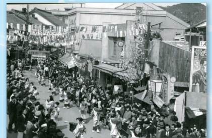
みなと祭の様子(昭和30年)↑