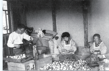
串柿づくり (昭和30年頃) 「御調町閉町記念誌より」 →