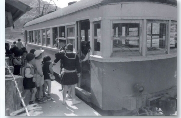
↑尾道鉄道で遠足へ(昭和32年)