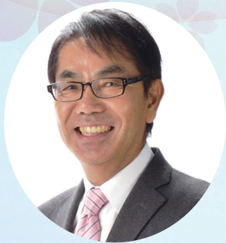
尾道市長 平谷 祐宏

尾道市は、明治31年4月1日に県内で2番目に市制を施行し、120年という長い歴史の中で、市民とともに少しずつまちの魅力を高めながら歩んできました。