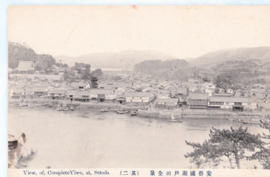
↑ 安芸国瀬戸田全景

平成11年瀬戸内しまなみ海道の全橋が開通し、島の特色を活かしながら、広く世界につながる文化と芸術の拠点づくりを進めてきました。