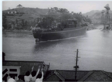
←日立造船向島西工場での大元丸進水式(昭和29年)