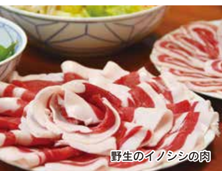
野生のイノシシの肉

市域面積の約87%が森林の本市。広大な雪山に多くの獣がいます。雪が降ると獣が足を取られるため、捕獲し易いと狩猟者は言います。冬は狩猟を楽しむ、貴重な野生のイノシシなどを味わえます。