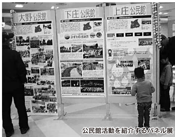
公民館活動を紹介するパネル展