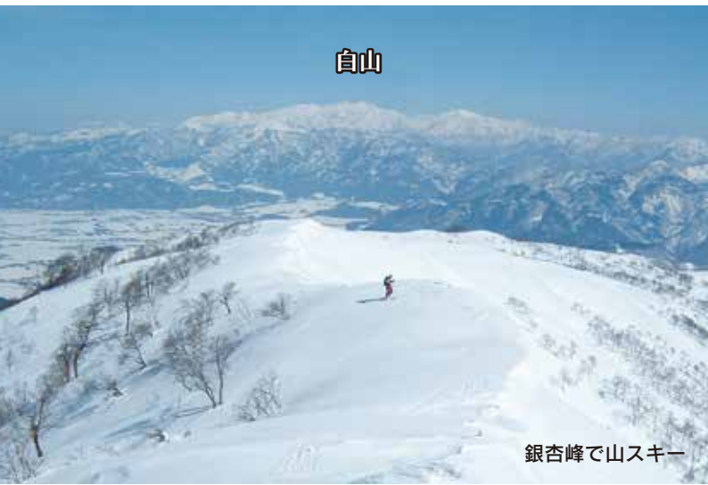
銀杏峰で山スキー