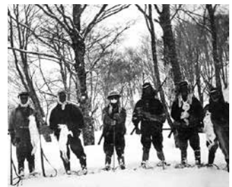
昭和32年撮影 小池のウサギ狩り