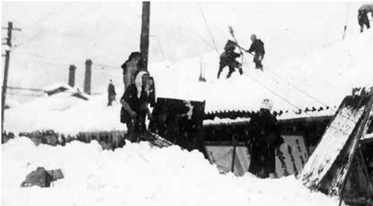
昭和11年撮影 雪が2階屋根まで達する

本市は、特別豪雪地帯に指定されています。豪雪なども経験していますが、昔から市民が雪に親しんできたことが分かる写真も多く残っています。