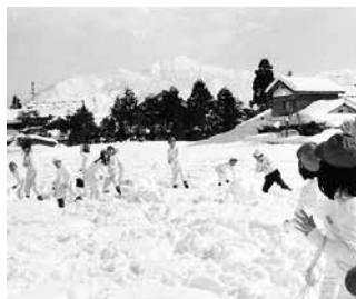
昭和49年撮影 有終南小学校の雪合戦