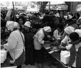
昭和55年撮影 六呂師雪まつり食コーナー