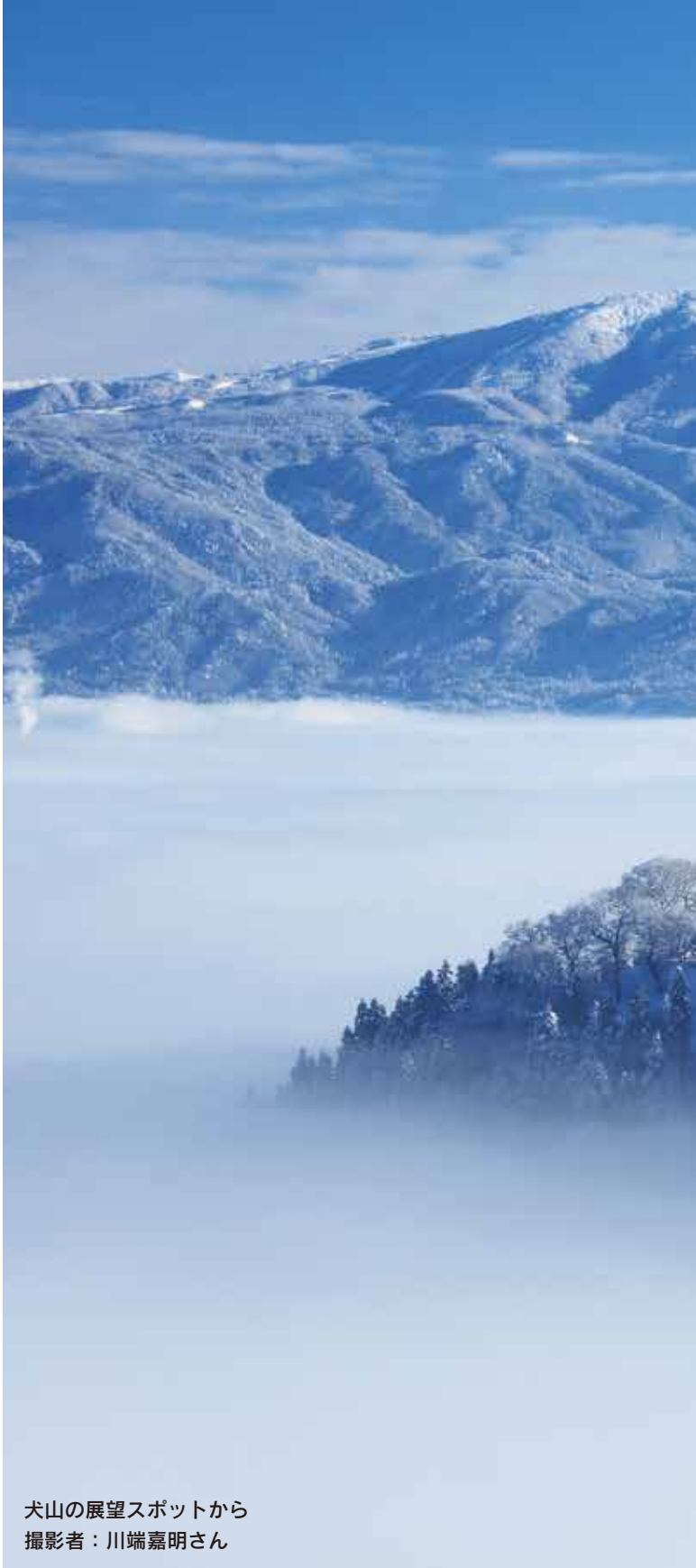
犬山の展望スポットから

日時 4日(田)午後5時～8時 場所 結ステーション 内容 冷えた体を温めるスープやおでんを販売します。東ティモールの豆を使ったコーヒートの振る舞いもあります