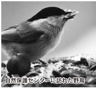
自然保護センターに訪れた野鳥