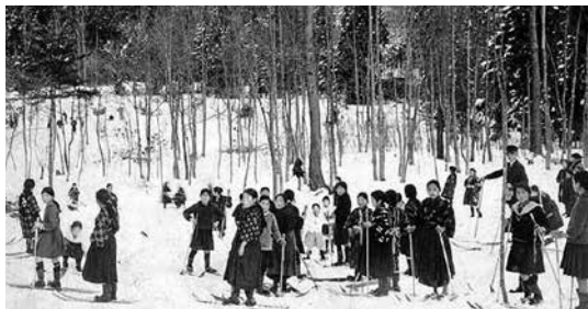
昭和13年ごろ撮影 飯降スキー場で遊ぶはかま姿の少女