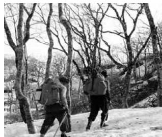
昭和33年撮影 冬の荒島岳登山