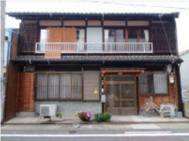
昭和3年築 住宅 西区那古野二丁目 H24.9.19