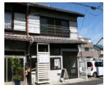
昭和15年築 ギャラリー 中村区亀島一丁目11-11 H24.11.1