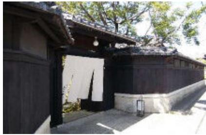
昭和14年 店舗 千種区西山元町1丁目58 H24.9.19