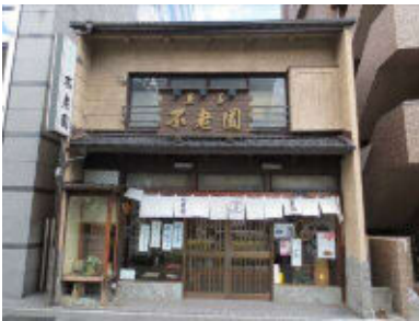
昭和30年築 店舗 中区古渡町11-32 H24.9.19