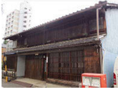
江戸末期築 住宅 西区幅下1丁目 H24.9.19