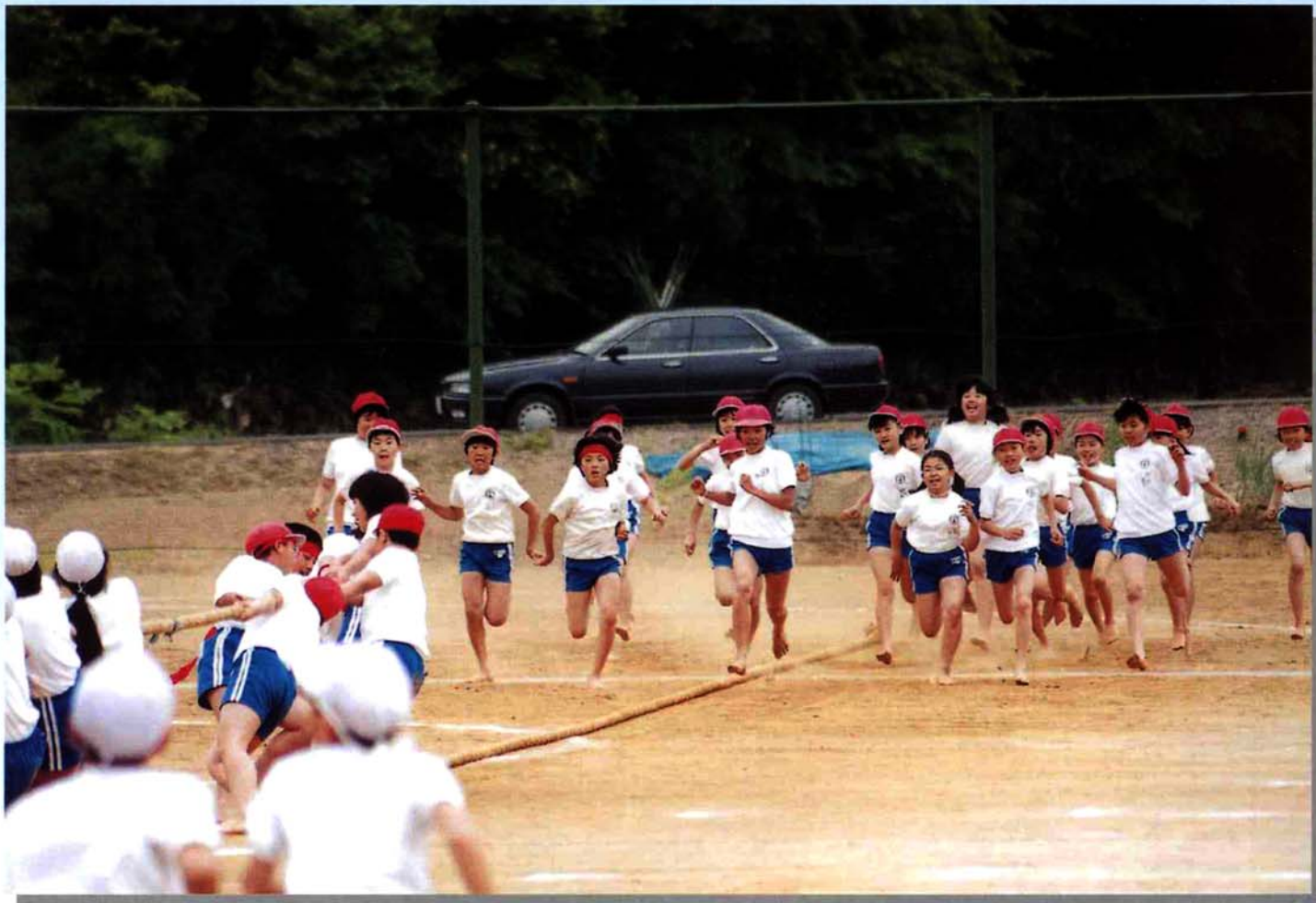
6月4日 日吉小学校大運動会