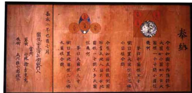
根立寺 観音堂にある奉納算額 縦63cm×横116cm

ガス企業団 ☎42-2671 水道企業団 ☎72-2259 みしま中央会館 ☎42-2222 与板郷消防署(斉場) ☎72-2572 みしま交流センター ☎42-2223 三島町体育館 ☎42-2756