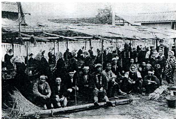
▲柳の皮むき風景（昭和8年頃）

その後、大正3年柳加工の先進地であった兵庫県豊岡市から講師を招いて講習会を開き、昭和の始め頃には地域の産業として杞柳細工 こりゅう （行李と小細工）が発展していきました。行李作りがピークを迎える昭和10～11年頃には、延徳村のほとんどの農家が柳を栽培し、新保集落だけで150町歩の柳田がありました。これらの農家の中には行李を専門に作る加工業者もあられ、行李組合を組織し、製品の品質管理と価格統一、問屋との交渉などを行い、自分たちの権益を守りました。