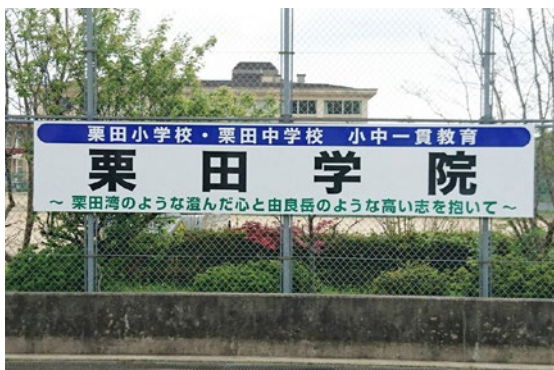
栗田小・中学校前に掲げられた栗田学院プレート

今後、「明日の宮津を創る子どもを育成する」という方針のもと、宮津市全体で小中一貫教育の取り組みを進め、子ども達の夢の実現とたくましい成長を支えていきます。