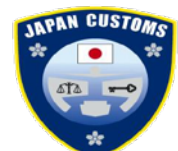
税関のロゴマーク