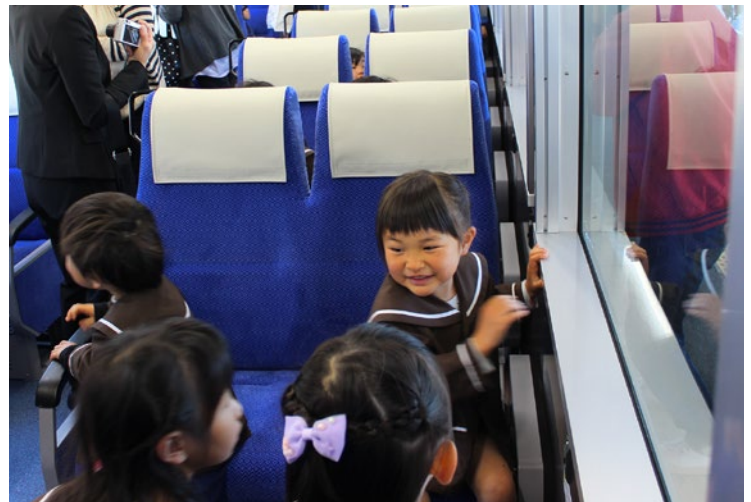
新しい車両に大興奮