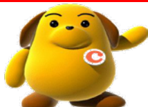
税関のイメージキャラクター カスタムくん

税関は6月28、29日に開催されるG20大阪サミット開催に向け水際でのテロ対策をより一層強化しております