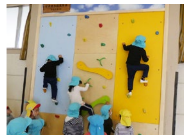
クライミングを楽しむ子どもたち