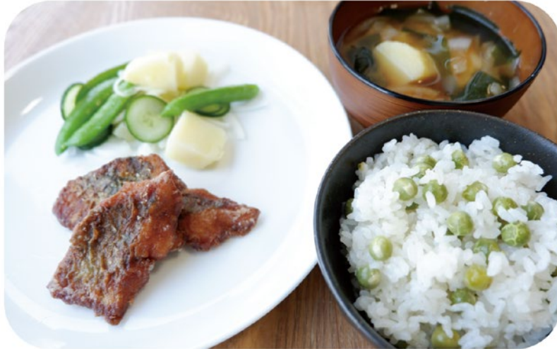
調理：深田貴央 (HAMAKAZE Cafe)