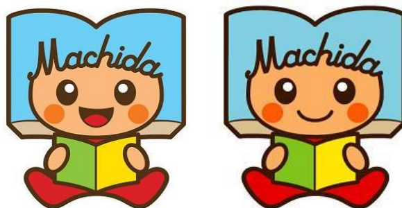
町田市立図書館キャラクター「よむぽん」

町田市子ども読書活動推進計画推進会議は、「町田市子ども読書活動推進計画」を効率的に推進するため設置されている会議です。会議は市民の代表9人と、市の関係部門4課の課長、図書館長の14人で構成されており、市民と行政が一緒に委員として協議するのが特徴です。この会議では、計画の進捗状況の検証に関すること、総合調整に関すること、計画の推進に係る情報交換及び連携に関することを行っています。