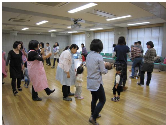
2歳児あつまれ！四季をあそぼ！