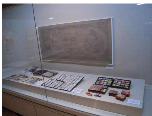
「1ねん1くみ1ばんサイコー！後藤竜二×長谷川知子」展 「尾辻克彦×赤瀬川原平－文学と美術の多面体」展