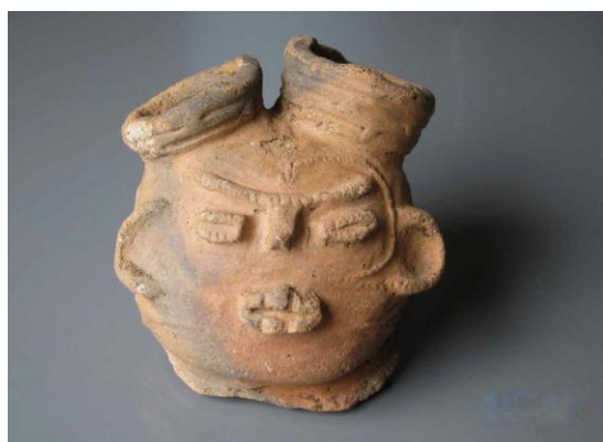
【町田市指定有形文化財 中空土偶頭部（田端東遺跡出土）】