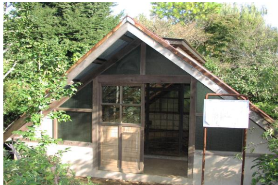
【国指定史跡 高ヶ坂石器時代遺跡】