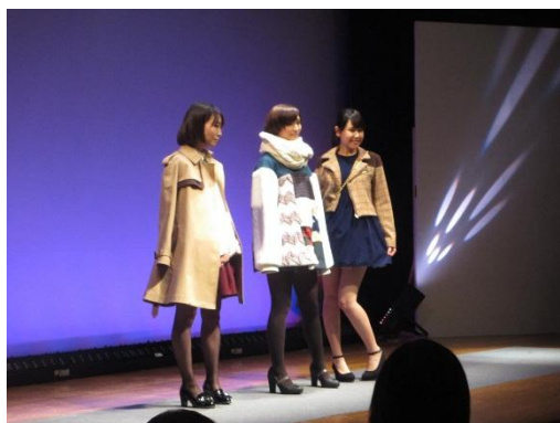
ファッションイベント「まちコレ」 (大学・専門学校、民間企業連携)

また、町田市と相模原市の行政と、2市を生活圏とする地域の大学、NPO法人、企業などが連携し設立された「公益社団法人 相模原・町田大学地域コンソーシアム（通称：さがまちコンソーシアム）」の事業を活用し、幅広いテーマの講座等を実施しています。2015年度は、「さがまちカレッジ町田市連携講座」として、「メタボ&ロコモ予防講座」や「感じて描いてリラックス『クリニカルアート』」、「世界にひとつしかない！乾漆技法によるおまもりオブジェの制作」など、学びの楽しさを実感し、学んだことを生活に活かせるような学習講座を開催します。