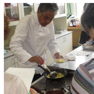
生涯学習ボランティアバンク

市民がより充実した生涯学習活動が行えるよう、様々な知識や技術、経験をもち、地域社会に役立てたいと考える市民又は団体と、身近な学習活動を通じて知識や技術を習得したいと希望する市民団体等の橋渡しをしています。また、この制度をより多くの方に利用してもらえよう、定期的に体験講座を実施しています。