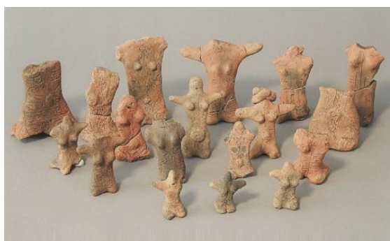
【町田市指定有形文化財 土偶一式（忠生遺跡出土）】