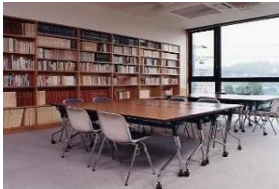
自由民権資料館閲覧室

さらに、資料館の前身の市史編さん室が収集した町田の歴史に関わる資料、周辺地域の各自治体史や歴史書なども同時に収集し、閲覧できる体制を整えています。