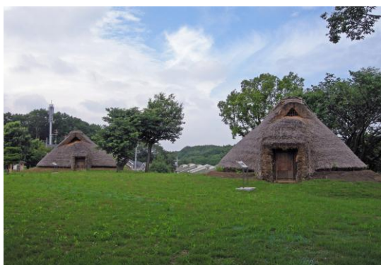
【東京都指定史跡 本町田遺跡】