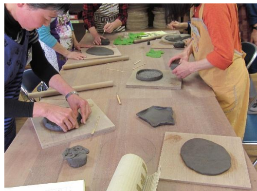
陶芸入門講座(作陶風景)