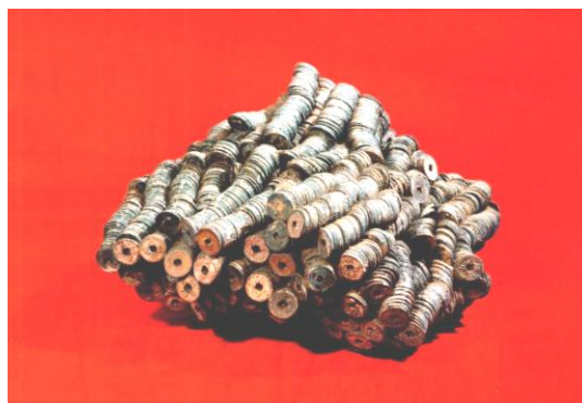
【町田市指定有形文化財 能ヶ谷出土銭（約1万枚の古銭）】