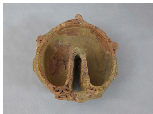
【町田市指定有形文化財 クルミ形土器（木曾中学校遺跡出土）】