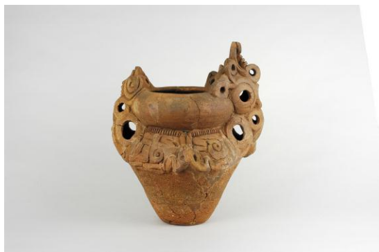
【町田市指定有形文化財 深鉢形土器（忠生遺跡出土）】