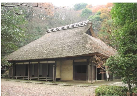
【東京都指定有形文化財 旧荻野家住宅】