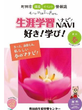
『生涯学習NAVI 好き！学び！』

市民が生涯学習を行う際に役立つように、町田市の講座・イベント情報誌『生涯学習NAVI 好き！学び！』を発行し、市内の公共施設で無料配布しています。