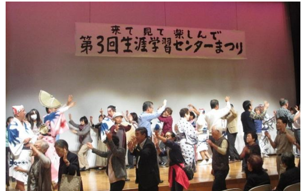
第3回(2014年度)生涯学習センターまつり

2014年度に開催した第3回生涯学習センターまつりでは、展示の部25団体、発表の部24団体が参加しました。