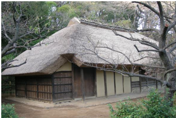
【国指定重要文化財 旧永井家住宅】