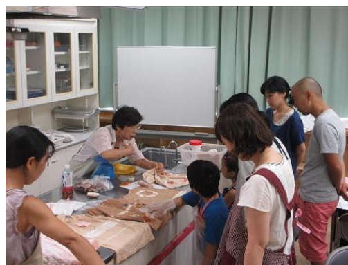
さがまちカレッジ 「身近な植物でTシャツを染めよう」