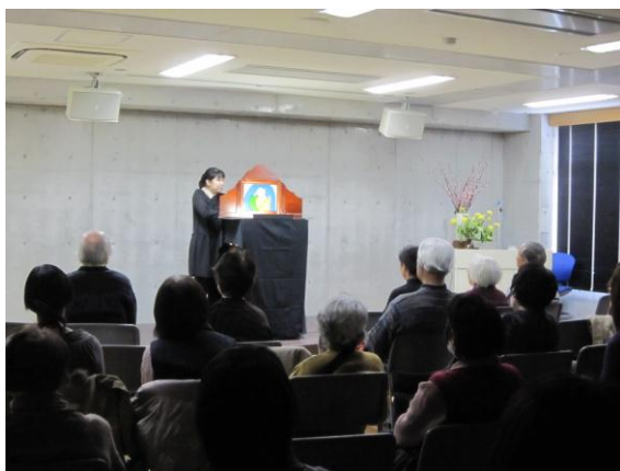
紙芝居・大人の時間