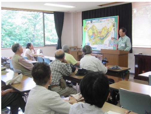
まちだ de エコ・ツアー(講座風景)

市民大学受講後には、修了生が任意で学習サークルを立ち上げて学びを継続しています。2015年4月現在、51の修了生団体が活動しています。