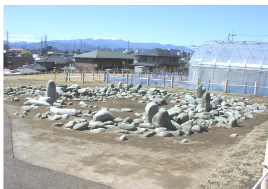
【東京都指定史跡 田端環状積石遺構】