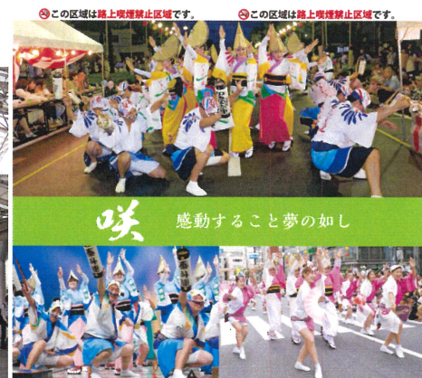
柱巻写真デザイン