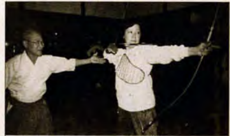
狙いを定めて — 的場池弓道場では、6月17日までの毎週火曜日と金曜日に初心者を対象にした「弓道教室」が開かれています。「弓を持つのは初めてだけど、キリキリと引き締まる瞬間の緊張感が大好き」と大好評。(写真は、5月20日)