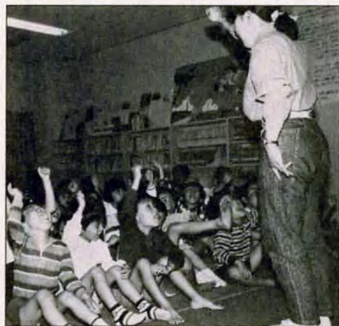
手も足も上げて「アイエイ」...5月21日、こども文化会館での「おとぎランド」。歌遊び、ゲームなど、楽しい催しがいっぱい。お姉さんとの息もびつたりでした。