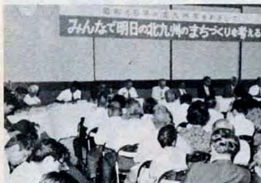
基本構想づくりを話し合う市民集会

計画づくりで一番だいじなことは、十分に市民の意思を聞くということですから、いろいろなアンケート、各区での市民集会などを通じて市民の声を聞き、計画に反映させていきます。そこで、次のように市民集会を