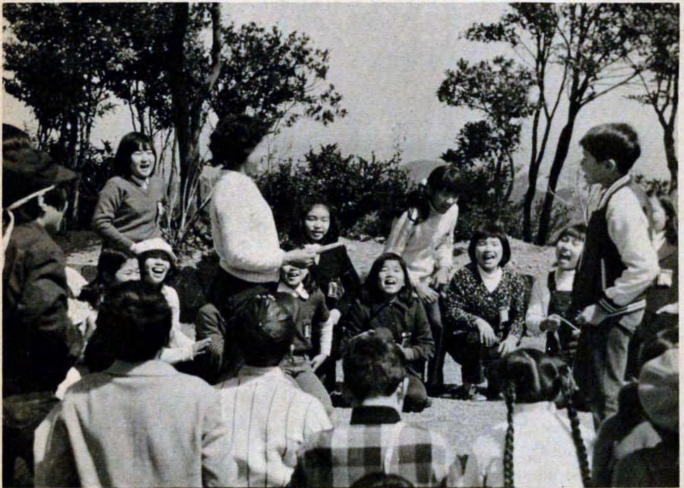
門司区矢筈山頂上で