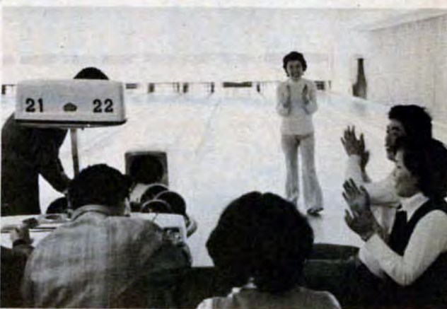
ナイスストライク！ 楽しいボウリングのひとつ