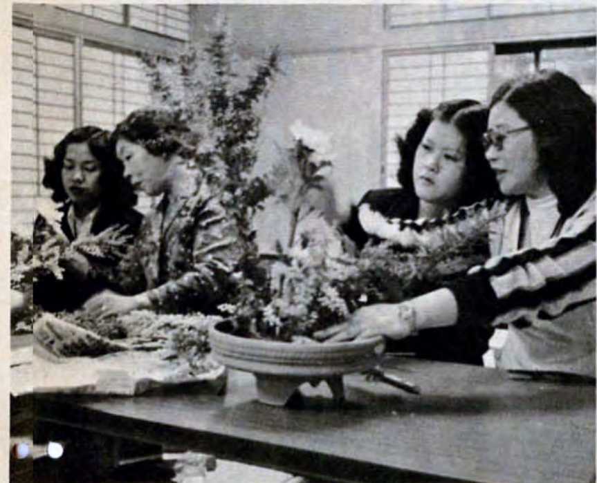
ホラ、ここはこうした方が生きてくるでしょう（生け花講座）