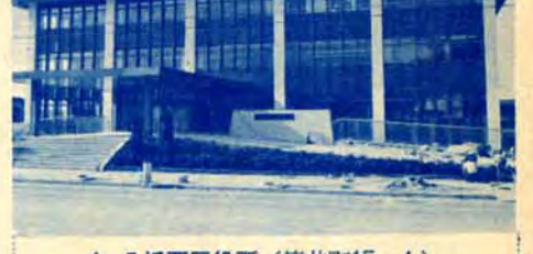
* 八幡西区役所(筒井町15-1)

八幡東区 ▶荒手一・二丁目、荒生田一〜三丁目、石坪町、祝町一・二丁目、枝光一〜五丁目、枝光本町、大蔵一〜三丁目、大谷一・二丁目、大宮町、尾倉一〜三丁目、大字枝光、大字大蔵、大字尾倉、大字小倉野(小倉北区に属する区域を除く)、大字田代(旧八幡区の区域に限る)、大字前田、大字若松(字葛島に限る) ▶勝山一・二丁目、上本町一・二丁目、神山町、川淵町、祇園一〜四丁目、祇園原町、清田一〜三丁目、豊勝町 ▶山王一〜四丁目、昭和一〜三丁目、白川町、末広町、諏訪一・二丁目 ▶高見一〜五丁目、竹下町、茶屋町、中央一〜三丁目、楓町一・二丁目、天神町 ▶中尾一〜三丁目、中畑一・二丁目、西合良町、西本町一〜四丁目、西丸山町 ▶羽衣町、八王寺町、花尾町、春の町一〜五丁目、東合良町、東鉄町、東丸山町、東山一・二丁目、日の出一〜三丁目、平野一〜三丁目、藤見町、帆柱一〜四丁目 ▶前田一〜三丁目、松尾町、宮田町、宮の町一・二丁目、桃園一〜四丁目 ▶豊町