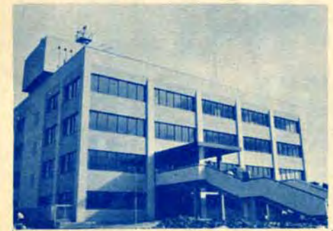
* 小倉南区役所(若園五丁目1-2)

八幡東区 ▶荒手一・二丁目、荒生田一〜三丁目、石坪町、祝町一・二丁目、枝光一〜五丁目、枝光本町、大蔵一〜三丁目、大谷一・二丁目、大宮町、尾倉一〜三丁目、大字枝光、大字大蔵、大字尾倉、大字小倉野(小倉北区に属する区域を除く)、大字田代(旧八幡区の区域に限る)、大字前田、大字若松(字葛島に限る) ▶勝山一・二丁目、上本町一・二丁目、神山町、川淵町、祇園一〜四丁目、祇園原町、清田一〜三丁目、豊勝町 ▶山王一〜四丁目、昭和一〜三丁目、白川町、末広町、諏訪一・二丁目 ▶高見一〜五丁目、竹下町、茶屋町、中央一〜三丁目、楓町一・二丁目、天神町 ▶中尾一〜三丁目、中畑一・二丁目、西合良町、西本町一〜四丁目、西丸山町 ▶羽衣町、八王寺町、花尾町、春の町一〜五丁目、東合良町、東鉄町、東丸山町、東山一・二丁目、日の出一〜三丁目、平野一〜三丁目、藤見町、帆柱一〜四丁目 ▶前田一〜三丁目、松尾町、宮田町、宮の町一・二丁目、桃園一〜四丁目 ▶豊町