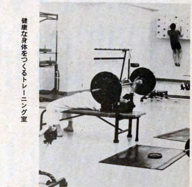
健康な身体をつくるトレーニング室

働く人のオアシス 働く市民の教養とレジャーの広場として、昨年10月1日にオープンしたレインボープラザ（市立勤労者会館）は、利用も順調にのび、半年目を迎えました。 北玄関前に噴水のある公園を備えた地上八階地下二階の近代的な建物には、いろいろな施設がいっぱい。地下一階は、健康的な身体をつくるトレーニング室（男女別）サウナ風呂、二十四レインのボウリング場。地上一階は、食堂街、理美容室、貸衣裳室、書店。二階は施設使用の申込み等を受け付ける管理事務室と若い二人の待ち合わせにピッタリな喫茶室やロビー。三階は、大谷公民館と労政事務所。四階は、研修や会議、展示場などに適した会議室や大会室。五階は、和室や音楽室、絵画室、将棋室などの趣味と娯楽の施設。六階は、今年2月10日に百組目のカップルが誕生した結婚式場。七階は、レストランと宴会場。八階には、四十二人が宿泊できるビジネスホテルなどがあります。 また、勤労者会館の教養講座として、茶道や絵画、ギター、写真、社交ダンスなど十コースの講座を4月と11月の二回開講（4月～9月の受講募集は締め切り済み）するなど、幅広くみなさんご利用を願っています。