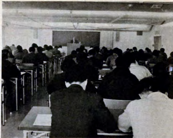
多人数の研修や講座に適した大集会室

募集します 身障者体育大会出場者 6月2日に行う第十二回北九州市身障者体育大会に参加する人を次のとおり募集します。 《資格》身障者手帳をもち、十六歳から五十五歳未満の人。 《種目》アーチェリー（洋弓）、車いす競走、砲丸投げ、やり正體投げ、盲人音韻走など。 《申込み》4月1日から5月4日までに、身体証明書を添えて、各身障協会が福祉事務所福祉課へ。 《健康診断》身体証明書は、4月1日から4月30日までに、次の保健所で受け付けてください。 ▽門司区 火曜日午後1時～3時 ▽小倉北 金曜日午後1時～3時 ▽小倉南 月曜日午後1時～3時 ▽若松 水曜日午後1時～3時 ▽八幡東 木曜日午前9時～11時 ▽八幡西 月曜日午後1時～3時 ▽戸畑 火曜日午前9時～11時 おばあちゃん大学生 対象は、六十歳以上の婦人（全期間出席の自信ある人で、おばあちゃん大学・入門学級卒業生を除く）。日程は、5月7・21日、6月4・18日、7月2・16・30日、8月6・20日、9月3・10・14日。時間はいずれも午後1時から4時10分まで、定員三百人。受講は無料。 希望者は、往復ハガキに住所、氏名、年齢、電話番号を記入して市社会福祉協議会（〒803小倉北区内1-11、522局4104）へお申込みを。連記不可。4月1日5月2日午前10時から福祉文化センター（戸畑市民会館横）で、入学式を行います。 消費生活モニター 資格は、市内に住んでいる主婦（経験者を除く）。定員は百人。モニターの仕事は、商品の価格や景目の調査、アンケートに答えること。期間は来年3月末日まで。謝礼は年六千円。景目調査用はかりを貸しあげます。 申込みは、4月10日までに区役所市民相談室消費生活センターへ。申込書は申込場所にあります。くわしくは、市消費生活課522局2058へ。 環境週間ポスター 6月5日～11日は環境週間です。市は、公害防止、自然環境保護、環境週間にちなむポスターを募集します。 資格は市内に住むか勤める人。作品は、画用紙（B3版・五十一センチ×三十八センチ）に二人一点。応募は4月30日までに市公害対策局企画調整課（〒803小倉北区内1-11、522局2395）へ。作品には住所、氏名、年齢、を書きつけてください。 賞は最優秀一点、優秀二点、佳作二点。賞状と記念品を贈呈。なお、応募者全員に参加賞をさしあげます。 交通局職員 市交通局では、職員若年名を募集します。 ▽職種Ⅱバスガイド、▽資格Ⅱ二十四歳未満の女性で、義務教育を終了した人。▽申込み希望者は、市交通局総務課人事係701局0036へ。