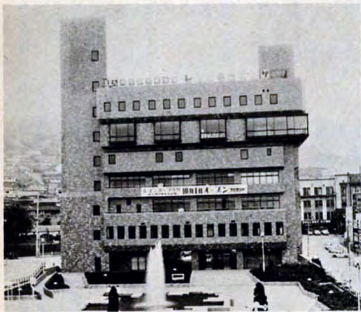
教養とレジャーの施設がいっぱいのレインボープラザ

働く人のオアシス 働く市民の教養とレジャーの広場として、昨年10月1日にオープンしたレインボープラザ（市立勤労者会館）は、利用も順調にのび、半年目を迎えました。 北玄関前に噴水のある公園を備えた地上八階地下二階の近代的な建物には、いろいろな施設がいっぱい。地下一階は、健康的な身体をつくるトレーニング室（男女別）サウナ風呂、二十四レインのボウリング場。地上一階は、食堂街、理美容室、貸衣裳室、書店。二階は施設使用の申込み等を受け付ける管理事務室と若い二人の待ち合わせにピッタリな喫茶室やロビー。三階は、大谷公民館と労政事務所。四階は、研修や会議、展示場などに適した会議室や大会室。五階は、和室や音楽室、絵画室、将棋室などの趣味と娯楽の施設。六階は、今年2月10日に百組目のカップルが誕生した結婚式場。七階は、レストランと宴会場。八階には、四十二人が宿泊できるビジネスホテルなどがあります。 また、勤労者会館の教養講座として、茶道や絵画、ギター、写真、社交ダンスなど十コースの講座を4月と11月の二回開講（4月～9月の受講募集は締め切り済み）するなど、幅広くみなさんご利用を願っています。