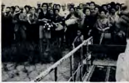
水道施設めぐり 6月2・3日の両日、参加者約300人が伊佐野取水場→畑貯水池→穴生浄水場→畑田貯水池を見学し、市の水事情を勉強しました。写真=中岡市伊佐野取水場で