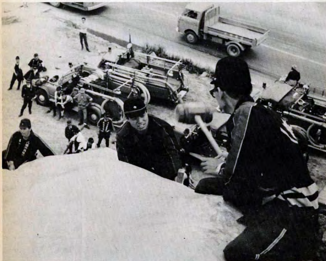
「がけくずれ」の想定でビニールを張る消防団員（6月5日八幡区京良城町で）