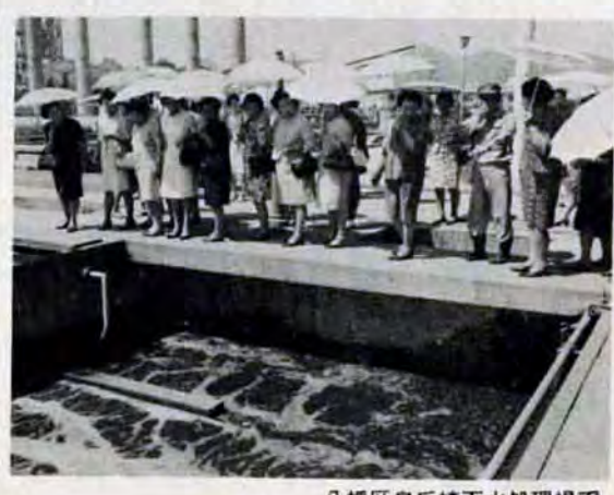
八幡区皇后崎下水処理場で

計画で市内の小中学校全部(うち八校は敷地などの関係でつくれない)にプールをつくる計画をすすめています。昨年は二十一校、ことしは二十四校、来年は二十五校につくります。 この計画が終わると、本市の小中学校百七十校(分校は除く)のうち以前にできたものを合わせるとうち百六十二校がプールをもつことになり、小中学校のプール保有率は九十五%になります。ことしプールをつくる学校はつぎのとおり 【門司】▼小学校田野浦、大里東、柄杓田、大里柳、松ヶ江北、大里南 ▼中学校港、吉野、柳西 【小倉】▼小学校西小倉、霧ヶ丘、長行、泉台、貫、徳力、吉田、北方、城野 ▼中学校霧ヶ丘、篠崎 【八幡】▼小学校河内、塔野 【戸畑】▼小学校戸畑 ▼中学校天嶺