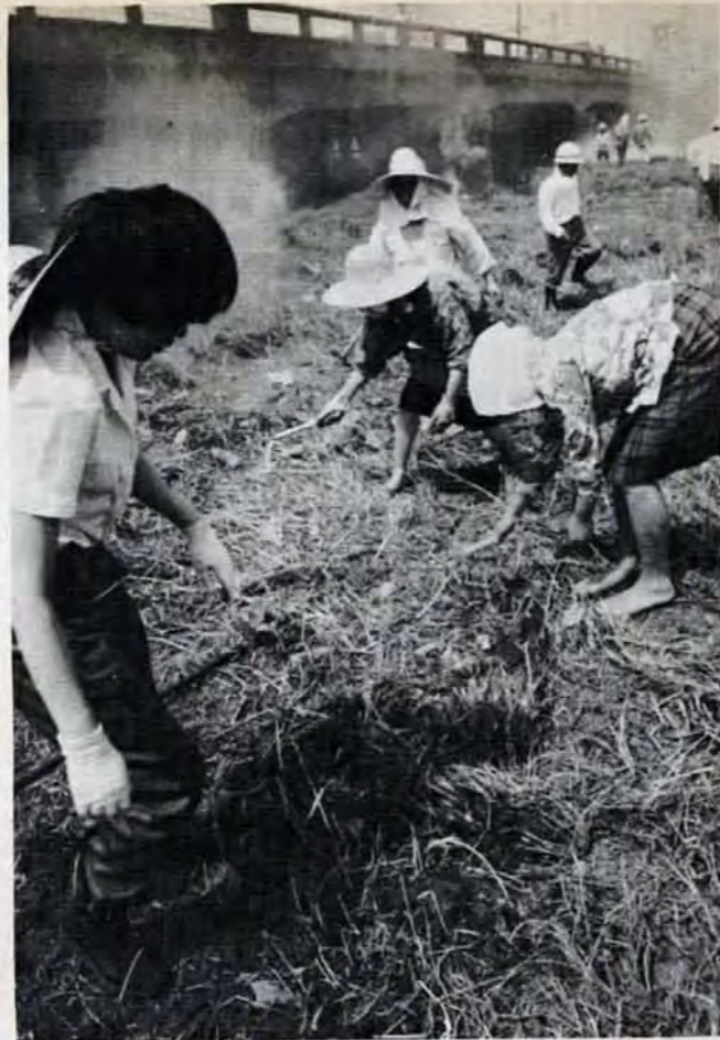
浄化運動をさらに盛り上げるため、6月1日に1周年記念の市民集会和パレード(写真下)を行いました。このあと約1,000人が2班にわかれ板橋川(写真上)と延命寺川の大掃除をしました。

市民運動は長続きしない、というこれまでの定説を見くつがえして、川を美しくする運動は、力強い盛り上がりを見せています。小倉の板橋川、延命寺川、八幡の大蔵川、堀川など、多くの川へと広がっています。八幡区は区内の川を全部きれい、というところまで発展しました。いっぽう県や市は市民運動の主旨を尊重して、側面から行政的な協力をしてきました。昨年度は600万円を使い、土砂のしんせつ、ゴミさらえ、啓蒙板やゴミすて防止柵の設置などをしました。ことし清掃、しゅんせつ、看板などに約2,700万円をあてています。また、川の美化にとどらず、町全体を美しくするため、このほど市内部に美化対策協議会を設け強力なバックアップの体制づくりしました。