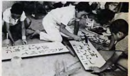
ボクたちも浄化にひと役……と、沿岸の小中学生も運動に参加しました。(長行小学校で)