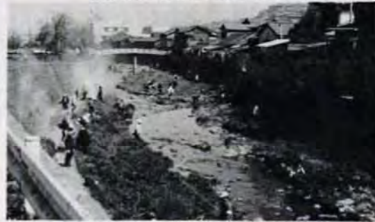
ことし3月23日には、八幡区大蔵川でも付近の人たち約600人がゴミさらえをしました。