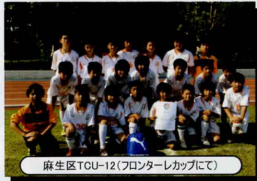
麻生区TCU-12(フロンターレカップにて)