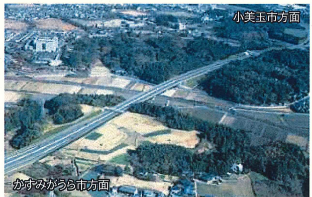
▲石岡市東田中付近