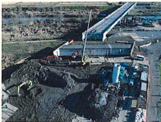
① 石岡地区改良工事