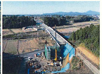
④ 東田中高架橋下部工事