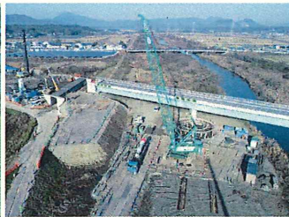
② 恋瀬川橋下部工事