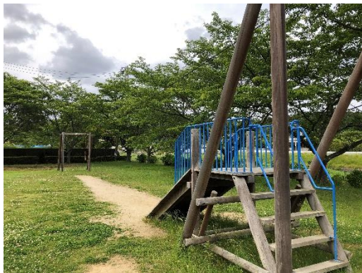
アスレチック遊具