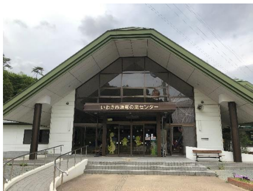
レストハウス正面