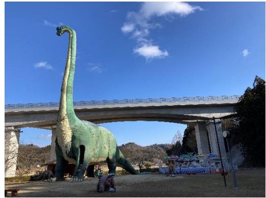
ブラキオサウルス滑り台