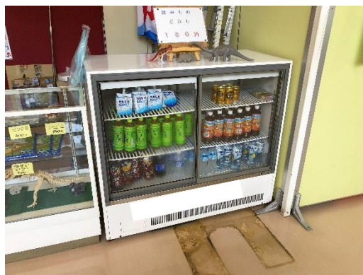
レストハウス内売店