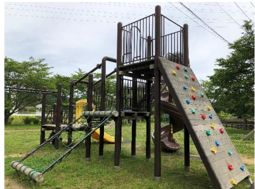
アスレチック遊具