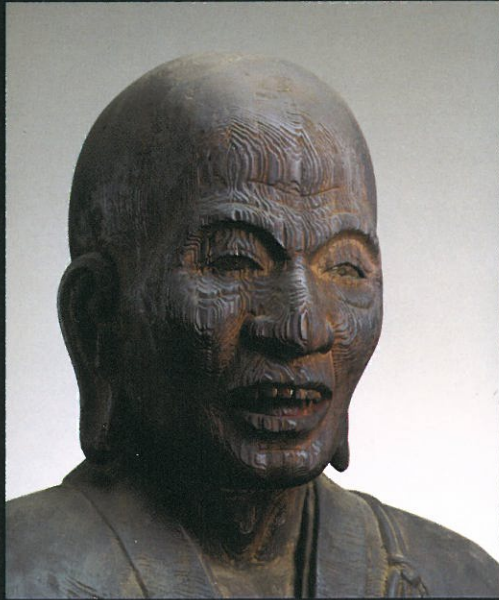
木造清賀上人像 (鎌倉時代・重要文化財)

かつては靈鷲寺といわれ、怡土七ヶ寺（染井山靈鷲寺・一貴山夷巍寺・小蔵山少蔵寺・鉢伏山金剛寺・浮獄久安寺・種宝山楠田寺、いずれも現在はほとんど廃寺）の本山として多くの僧坊があり、雷山三百坊と言われていたようです。