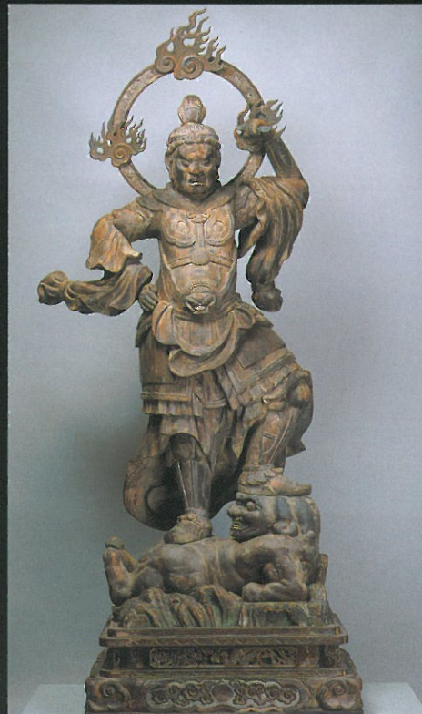
木造二天像（左：多聞天像 右：持国天像）