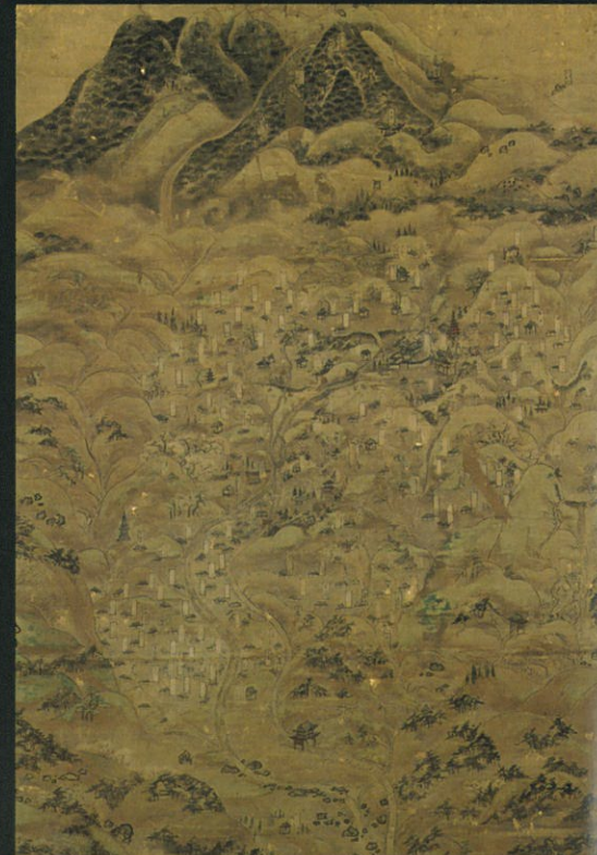
雷山古図（江戸時代・重要文化財）