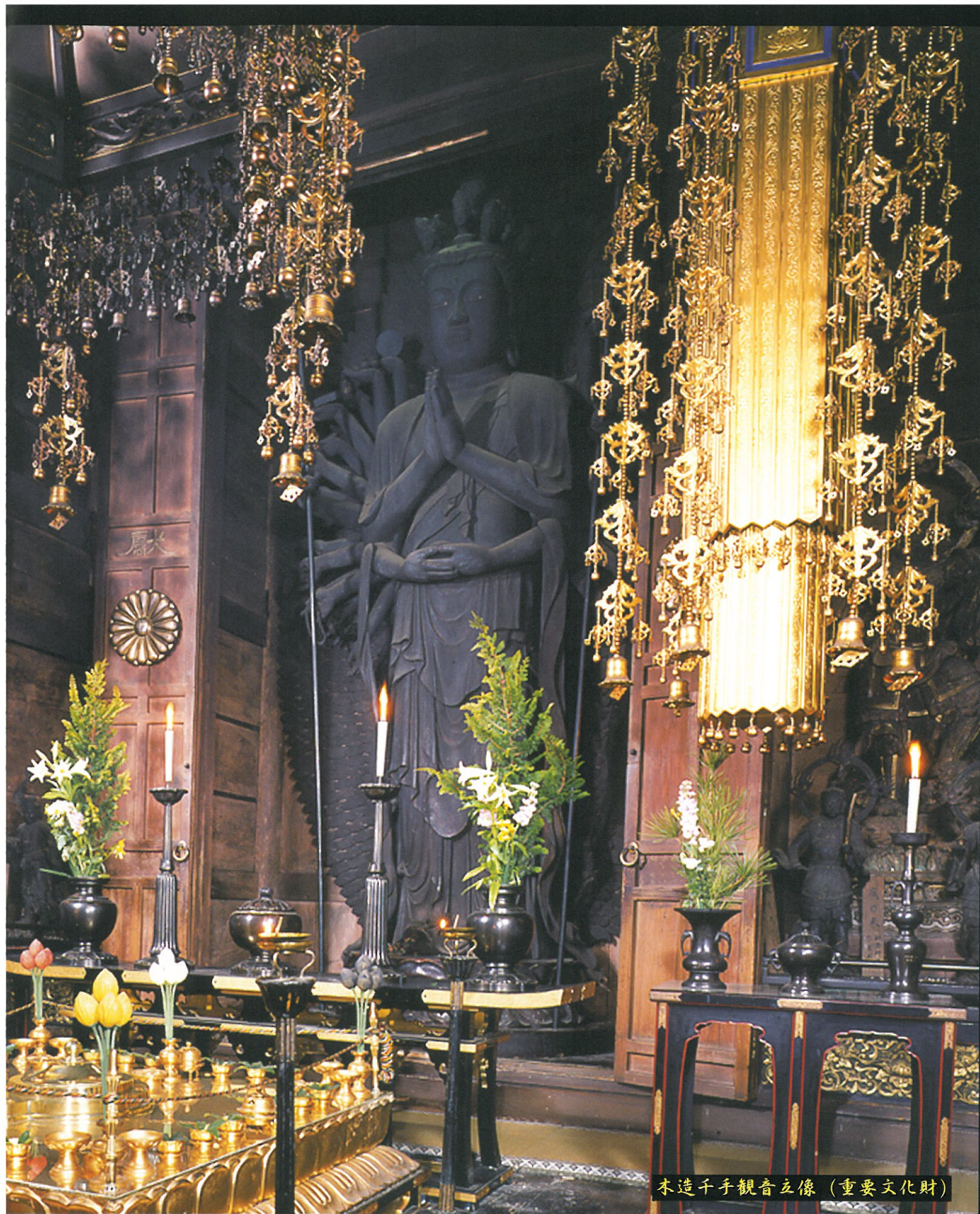
木造千手観音立像（重要文化財）

大悲王院の本尊・木造千手観音立像は鎌倉時代後期（14世紀頃）の作と推定され、像高4.63mで九州でも屈指の大きさを誇ります。千手観音は、衆生を救うべく千手を持つとされるもので、一般的には四十八臂に省略されますが、本像は実際に千手の表現がされている珍しい例です。