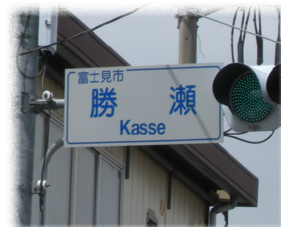
護国寺そばの交差点にある地点名標識は昔のまま

雑学7：『勝瀬』の読み方は「かつせ（KATUSE）」？ それとも「かっせ（KASSE）」？ 地元では昔から「かっせ（KASSE）」と呼んでいますが、現在の正式呼称は「かつせ（KATUSE）」です。