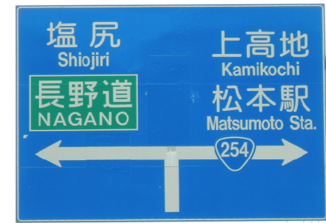
長野県松本市内に設置された道路標識（案内標識）

雑学10：一般に川越街道と呼ばれている国道254号線ってどこまで続いているの？川越？それとも東松山？ いいえ、もっと遠くまで続いています。寄居、下仁田（群馬）佐久（長野）などを經由して、終点は北アルプスの山並みを望む松本市（長野）です。因みに始点は本郷三丁目交差点（文京区）で、総延長は約224kmあります。