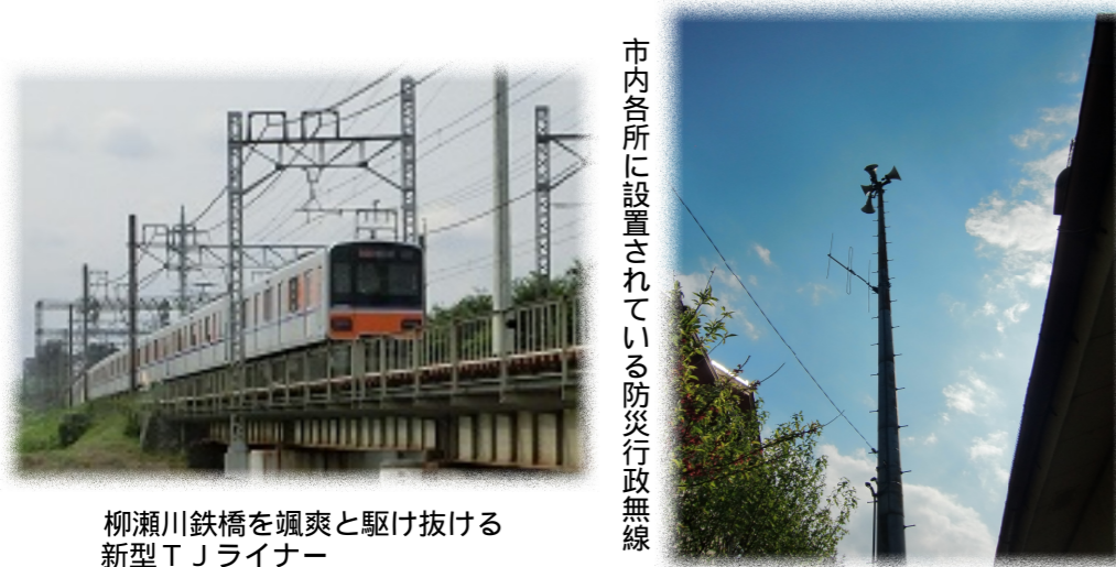
柳瀬川鉄橋を颯爽と駆け抜ける新型TJライナー

雑学2：東上線の新造車両はどこから入れるの？ 通常は次のルートで搬入されます。 車両工場（JR路線を牽引されてくる） JR熊谷貨物ターミナル駅（秩父鉄道路線を牽引されてくる） 寄居駅（東上線を自走） 森林公園車両基地