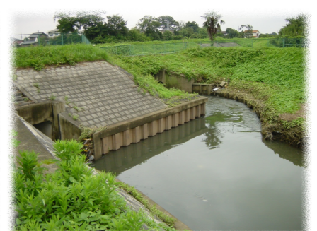
砂川堀（新河岸川との合流地点付近）

雑学8：砂川堀はどこからきているの？ 市内の桜の名所となっている砂川堀ですが正式名称を『砂川堀都市下水路』といい、狭山丘陵北側の早稲田大学演習林が水源です。所沢からふじみ野市を通り伊佐島で新河岸川に合流します。水路延長約13kmには調整池や暗渠があり、小手指では119本のしだれ桜並木があります。