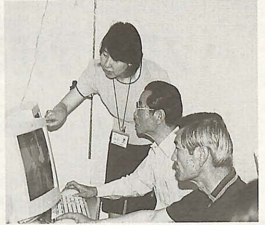
講習は一つひとつみんなが分かるまで