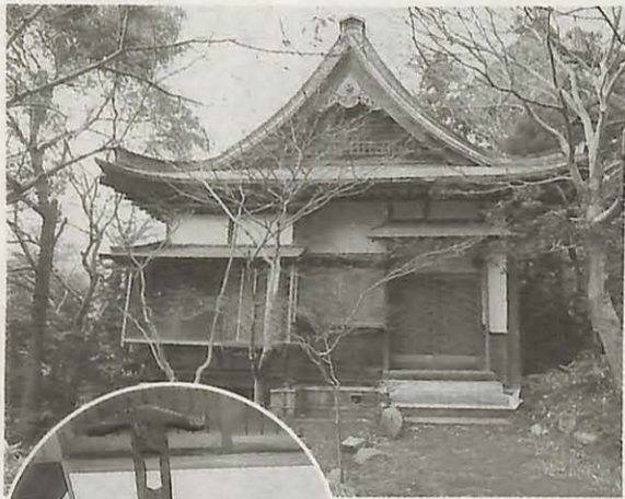
新館は、昭和元年に建築された朝鮮風別荘。バーナード・リーチのデザインによる三角イスも展示されています。