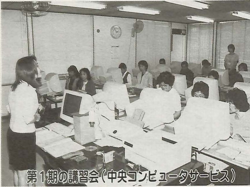
第1期の講習会(中央コンピュータサービス)

市では、国のIT推進事業による「IT講習会」を、約7000人を対象に開催しています。受講料は無料。パソコンが初めての方を対象に、基本操作から文書作成、インターネットによるホームページ・電子メールの利用方法まで学びます。今回は、8月から10月までの第2期講習会の受講者募集についてお知らせします。