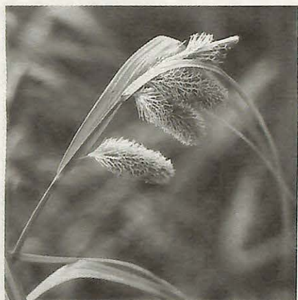
ショウロウスゲ (かやつりぐさ科)

口座振替のご利用を 口座振替の手続きは、次の金融機関で取り扱っていますので、ご利用ください。 問い合わせ 国保年金課・内線353・354