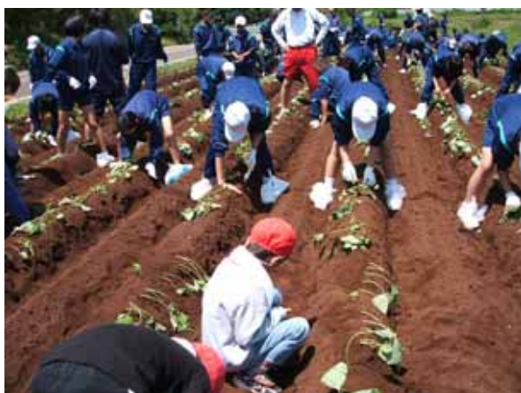
小中合同による『芋の苗植え』