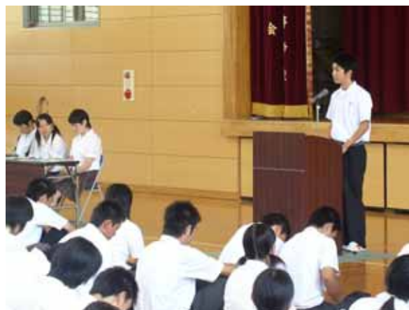
『中高合同英語暗唱会』